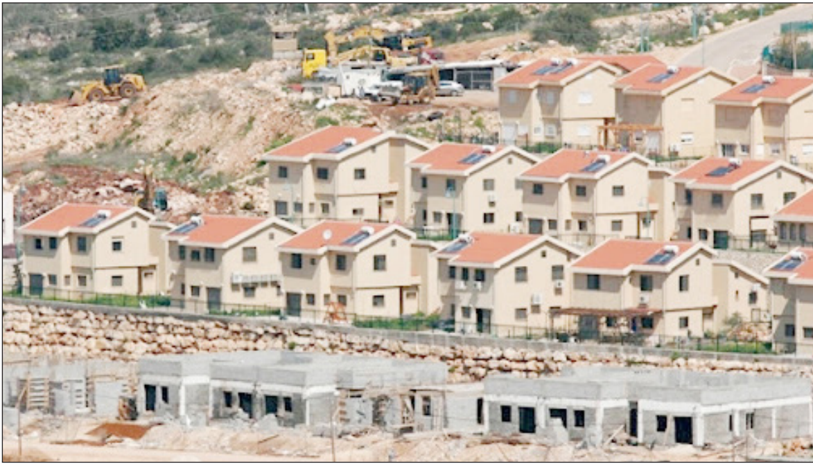
الاحتلال يشرع في إقامة البؤر الاستيطانية في أحياء الضفة الغربية المحتلة (أرشيف)

وأقيمت مستوطنة كريات أربع، عام 1968 على أراض من مدينة الخليل بالضفة الغربية المحتلة. وتضم "كريات أربع" أكثر من 7510 مستوطنين، حسب "دائرة الإحصاء