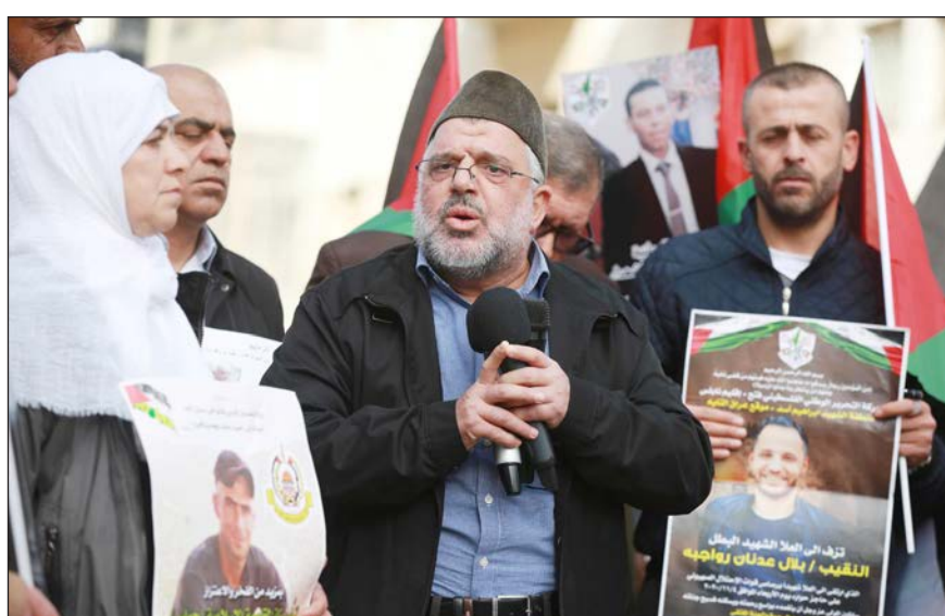
وقفة في رام الله تطالب باسترداد جثامين الشهداء المحتجزة لدى الاحتلال أمس

رام الله/ فلسطين: أكد القيادي في حركة حماس حسن يوسف، أمس، أن المقاومة تعمل على تحرير جثامين الشهداء الفلسطينيين المحتجزة لدى سلطات الاحتلال الإسرائيلي. جاء ذلك في كلمة ألقاها في وقفة وسط مدينة رام الله، نظمها أهالي شهداء بلدة بدو في القدس المحتلة، للمطالبة باسترداد جثامين الشهداء في ثلجيات و"مقابر الأرقام" لدى الاحتلال. وشدد يوسف على وجوب أن "تعود جثامين الشهداء إلى أهلها كي تعزز وتكرم الإكرام الذي ينبغي أن يكون عليه من شعبنا وأهلهم