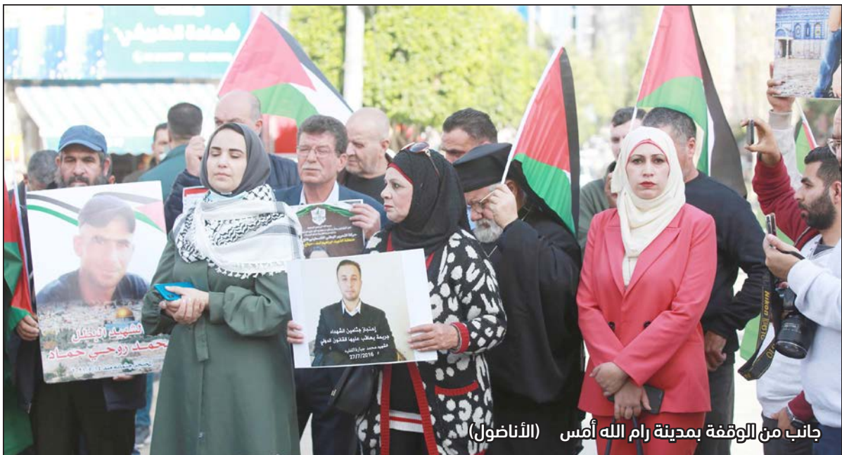
جانب من الوقفة بمدينة رام الله أمس