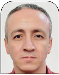
أحمد الجندي العربي الجديد

وعلى الرغم من أن الشعوب العربية لا تزال تحتفظ بموقفها الداعم للحق الفلسطيني، والرافض للاحتلال، والمدرّك بأن المشكلة، في الأساس، ترتبط بوجود الاحتلال وليس مقاومته، فإن ذلك لم يمنع من وجود أصوات عربية شاذة تتهم من يقاوم المحتل بالإرهاب وتتماهى مع موقف الاحتلال والغرب