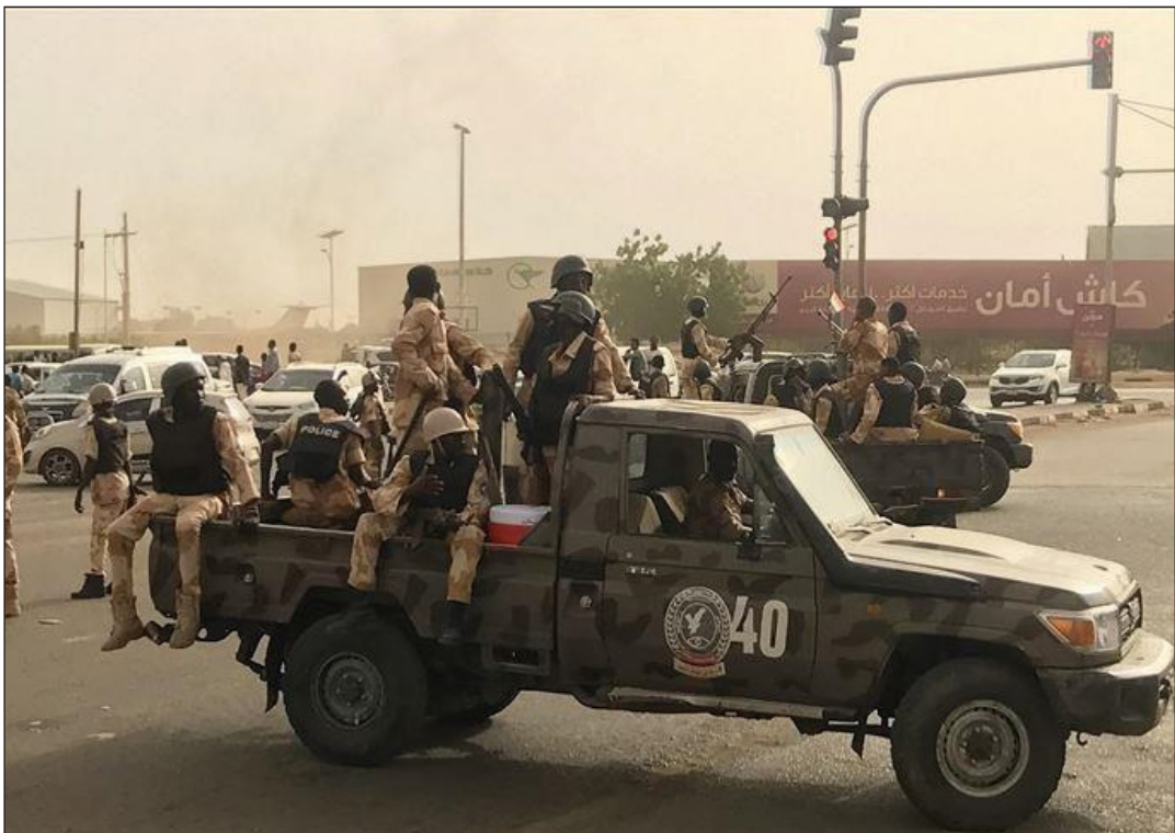
انتشار قوات الأمن عقب مقتل 43 سودانياً في التظاهرات

وكشفت مقاطع بثت مباشرة على مواقع التواصل الاجتماعي احتجاجات في مدن منها بورسودان وكسلا وود مدني والجنينة. وعلى الرغم من أن إعادة تعيين حمدوك كانت تنازلاً من جانب البرهان، فإن الأحزاب السياسية والجماعات المدنية الرئيسية تقول إنه يتعين على الجيش ألا يلعب أي دور في السياسة.