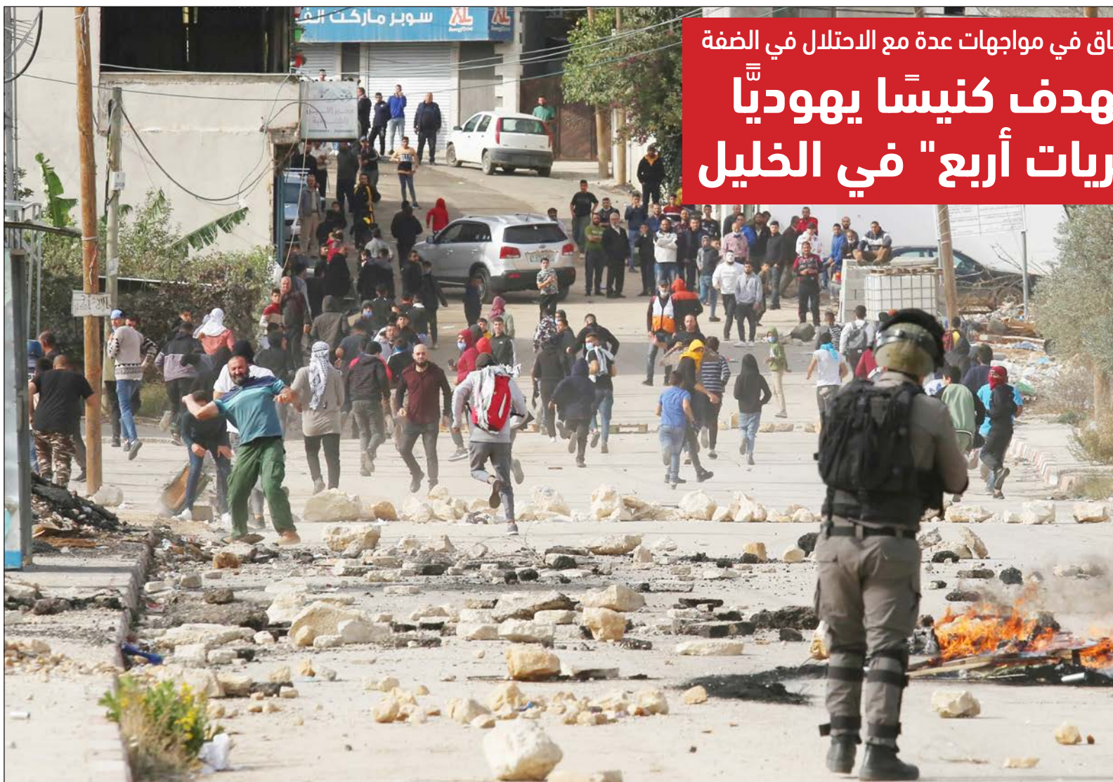
مواجهات بين الشبان وجنود الاحتلال في قرية اللبنة الشرقية بعد احتجاج الأهالي على مهاجمة المستوطنين بحماية الجيش مدارس القرية أمس