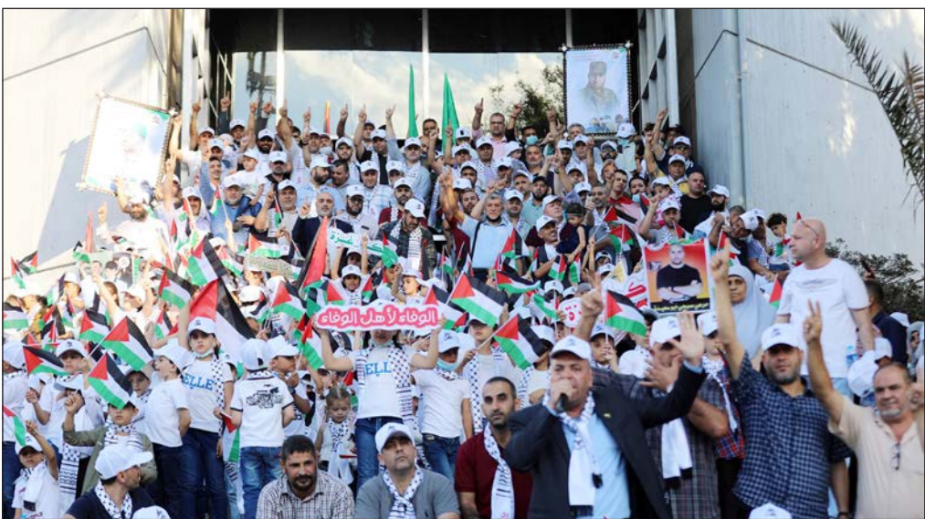
وزارة الأسرى تنظم فعالية في ذكرى صفقة وفاء الأحرار بغزة أمس

وزارة الأسرى: ذكرى وفاء الأحرار تعيد الأمل بقرب إنجاز صفقة جديدة