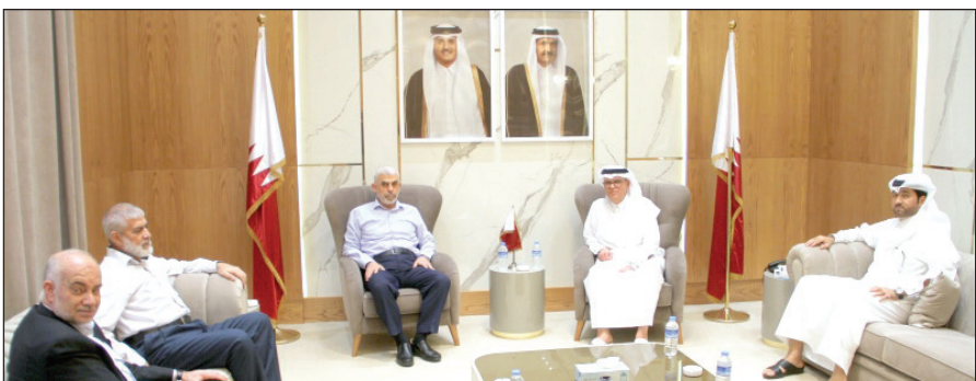
"السنوار" خلال لقائه "العمادي" في غزة أمس

غزة/ فلسطين: وذكرت اللجنة القطرية على موقعها الإلكتروني، أن العمادي ناقش مع وفد حماس، الأوضاع السياسية الراهنة وتطورات الأوضاع على الساحة الفلسطينية، معرباً عن حماس في قطاع غزة برئاسة يحيى السنوار.