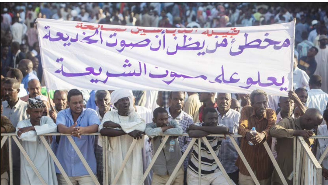
مئات السودانيون يواصلون الاعتصام أمام القصر الرئاسي بالخرطوم أمس

وتضمّ مجموعة "الميثاق الوطني" كيانات حزبية وحركات مسلحة، أبرزها حركة تحرير السودان بزعامة حاكم دارفور مني أركو مناوي، وحركة العدل والمساواة بزعامة جبريل إبراهيم وزير المالية الحالي. وتوجه المجموعة الجديدة اتهامات لقوى الحرية والتغيير المعروفة باسم مجموعة "المجلس المركزي الحاكم" بالسعي للانفراد بالسلطة عبر إقصاء باقي التيارات المدنية في البلاد.