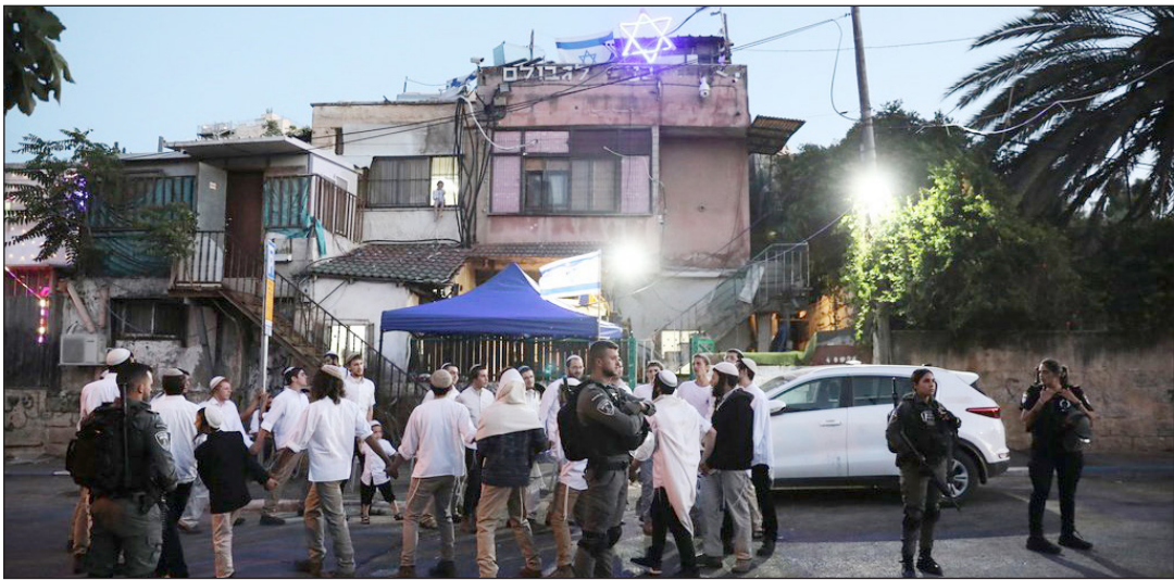
مستوطنون يستولون على منزل فلسطيني في حي الشيخ جراح (أرشيف)

ليست بعيدة عن مقترح محكمة الاحتلال، بل هدفها جر أهل الحي بشكل ناعم إلى قبولها". وأكدت أن "قضية حي الشيخ جراح باتت قضية فلسطينية وعربية وإسلامية وعالمية، وباتت رمزاً من رموز الصراع مع الصهيونية على أرض فلسطين، ولا يصح بأي حال مقاربتها من زاوية الملكية البحثية أو بمنطق توريث أهل الحي والمحامين منفردين بتقرير مصيرها". وشددت على أن "هذا يستدعي بالضرورة أن تُعلن القوى السياسية وعلى رأسها قوى المقاومة موقفها من أهل الحي، وأن الإرادة التي خاضت حرباً لأجلهم لن تتركهم أو تتخلّى عنهم، ولن تسمح لمحاكم الاحتلال بالاستفراد بهم". ودعت مؤسسة القدس جماهير شعبنا إلى تجديد الالتفاف حول قضية أهالي حي الشيخ جراح والتصدي لمخططات الاحتلال وأذرعه المختلفة.