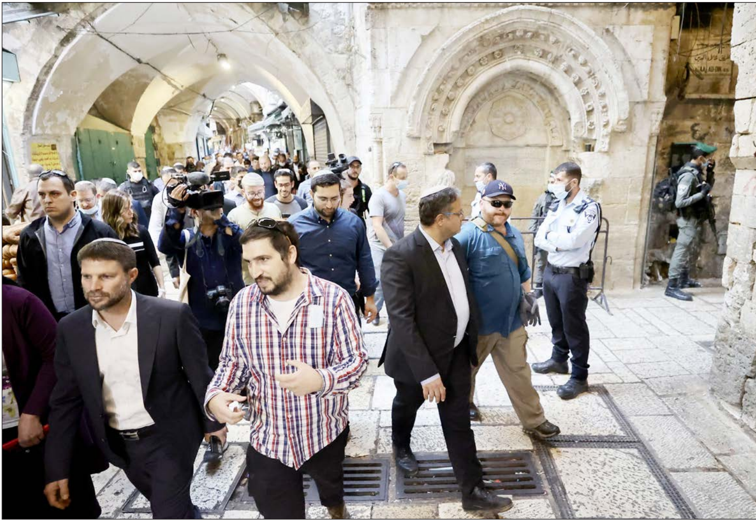
مستوطنون يقتحمون منطقة باب العمود بحراسة مشددة من قوات الاحتلال أمس

شن حملة دهم واعتقالات طالت قيادات ومُحرّرين