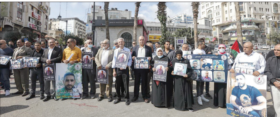
وقفة مساندة للأسرى المضربين عن الطعام في رام الله أمس