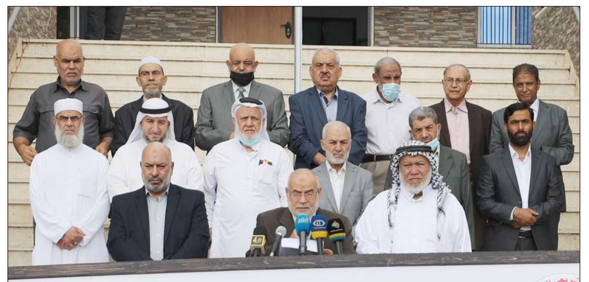
وقفة برلمانية في ذكرى صفقة وفاء الأحرار بمدينة غزة أمس