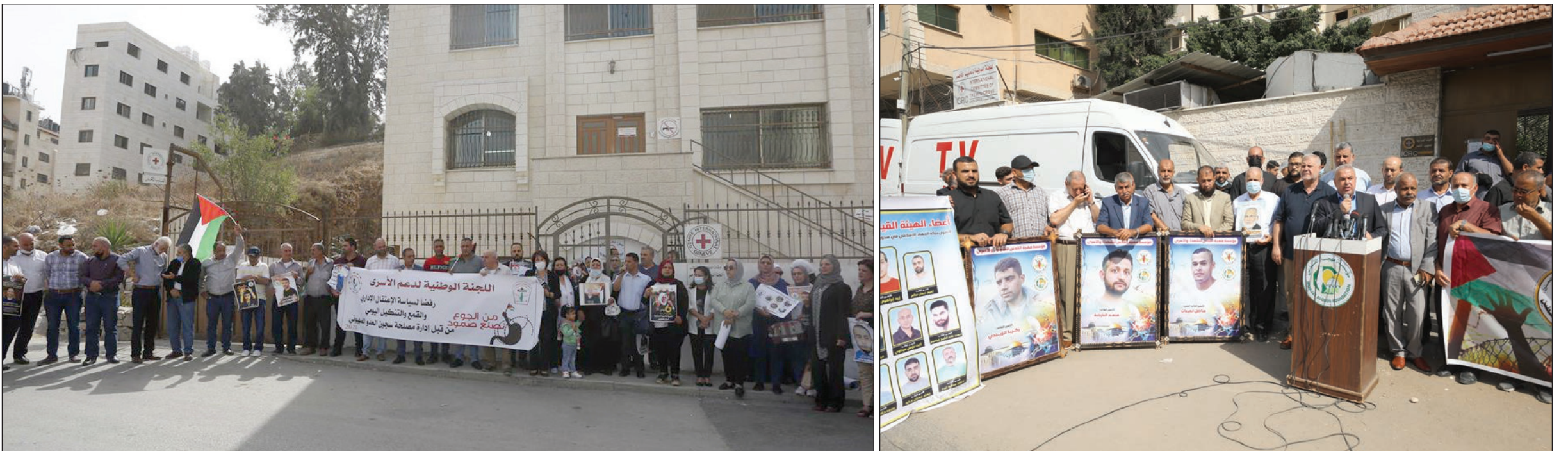
مواطنون وأهالي أسرى ينظمون وقفات تضامنية مع الأسرى أمام مقر الصليب الأحمر الدولي في غزة ونابلس أمس

جبارين: المقاومة مستعدة للدفاع عن خطوات الأسرى الموحدة | البطش: كل الخيارات مفتوحة أمام شعبنا للدفاع عن الأسرى | فؤاد: سنعمل على توحيد جهودنا وإمكاناتنا لمنع التطاول على الأسرى