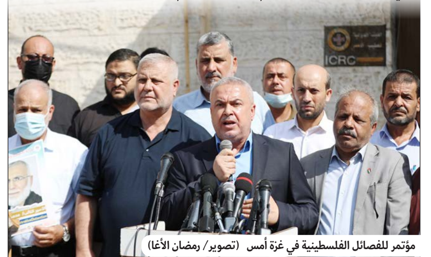
مؤتمر للفصائل الفلسطينية في غزة أمس

حذرت فصائل فلسطينية الاحتلال الإسرائيلي من المساس بالأسرى الذين يخوضون إضراباً مفتوحاً عن الطعام، رفضاً للإجراءات العقابية التي فرضتها إدارة السجون بحقهم، محملة