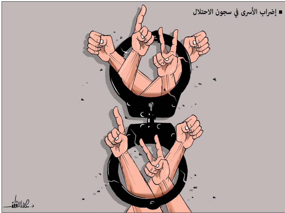
■ إضراب الأسرى في سجون الاحتلال

واستطرد السير بول قائلاً: "تصريحاته السياسية صحيحة تماماً، وعميقة حقاً، وشجاعة حقاً، وتقدم باستمرار بطريقة حديثة، لقد سعدت أن أتاحت لي الفرصة لاقتناء وإمتلاك أحد أعماله، كما أن لوحة زهرة الشمس نفسها تقدم طريقة فريدة رائعة للتفكير في الأشياء". وتعليقاً على عرض اللوحة للبيع، قالت كاثرين أرنولد، رئيسة قسم كريستي للفن المعاصر في أوروبا في مرحلة ما بعد الحرب، بعد السعر القياسي الذي سجلته لوحة جيم تشينغر في آذار (مارس)، وهي عمل زيتي آخر على القماش للفنان بنكسي: "يسعدنا أن نعرض لوحة زهرة الشمس من محطة الوقود في تشرين الآخر (نوفمبر)".