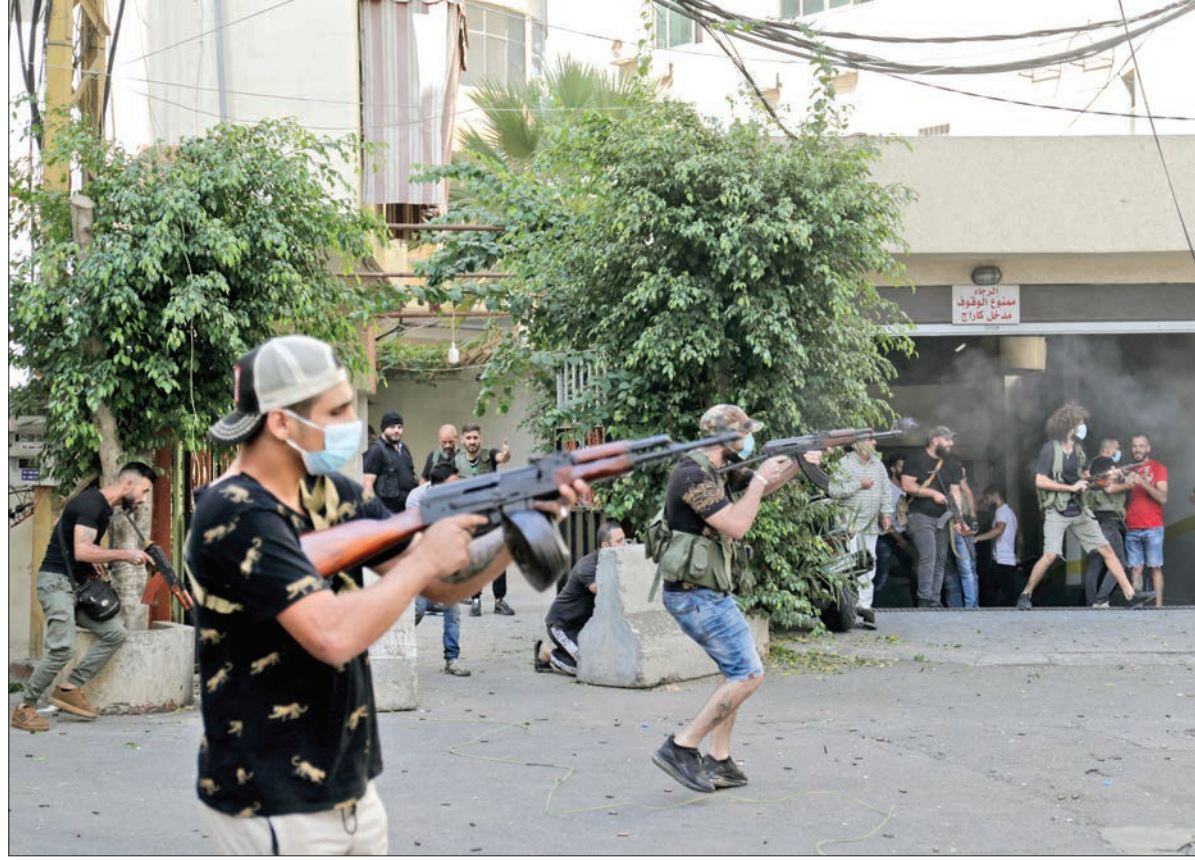
مسلمون يطلقون النار خلال اشتباكات في العاصمة بيروت أمس