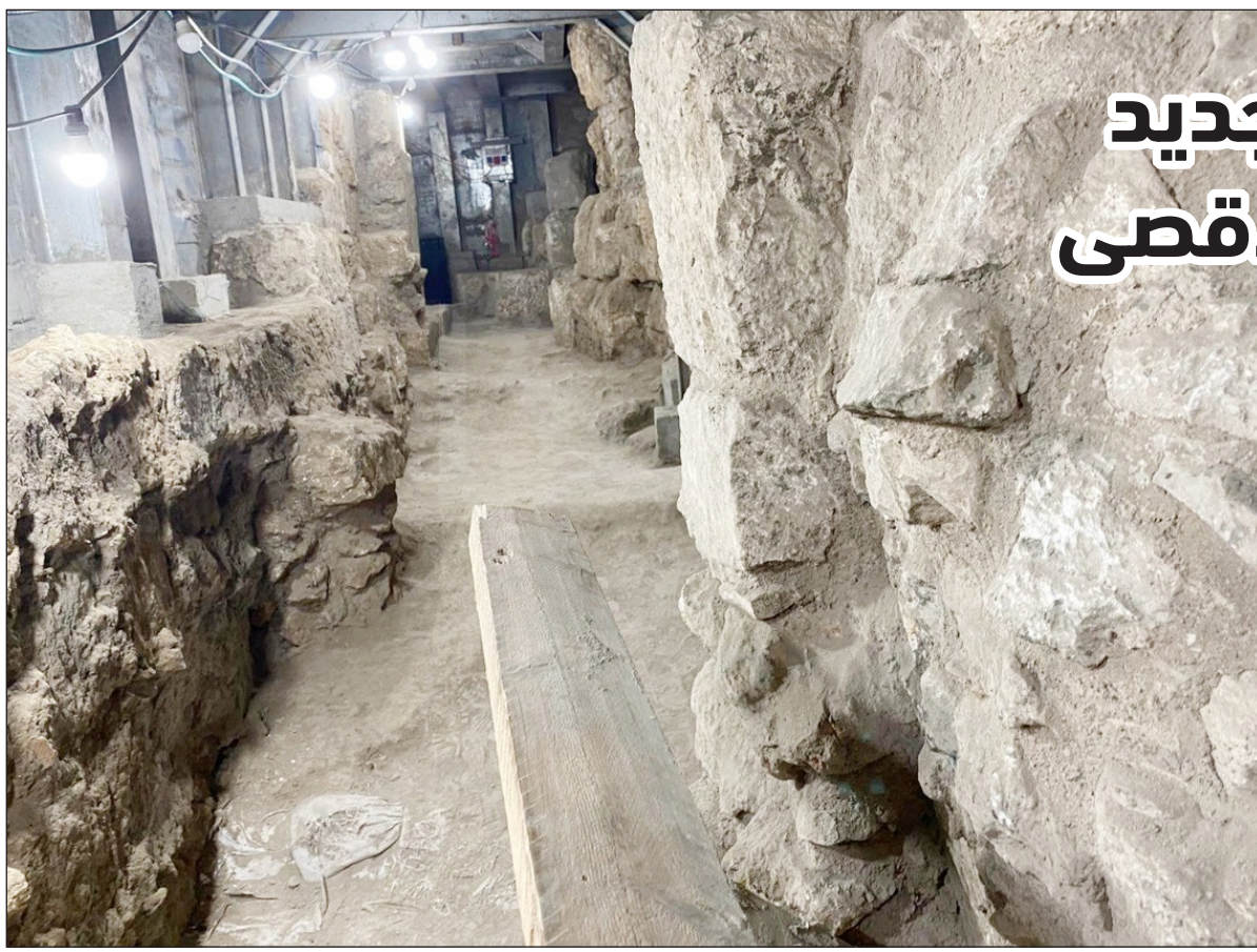
النفق الذي كُشف عنه في مدينة القدس المحتلة أمس

أدنت فصائل فلسطينية، أمس، قصف الاحتلال الإسرائيلي على ريف حمص في سوريا، الذي أدى إلى استشهاد جندي سوري وجرح ثلاثة آخرين. وعدت حركة المقاومة الإسلامية حماس، القصف الإسرائيلي على سوريا، "عدواناً