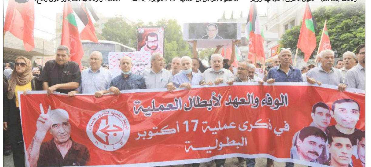
مسيرة للجبهة الشعبية بمدينة غزة إحياء لذكرى عملية 17 أكتوبر أمس