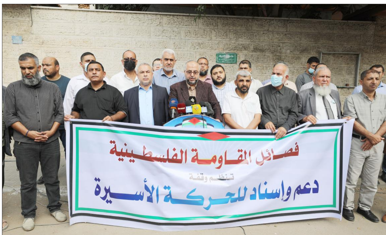
وقفة لفصائل المقاومة الفلسطينية بمدينة غزة تضامناً مع الأسرى في سجون الاحتلال أمس