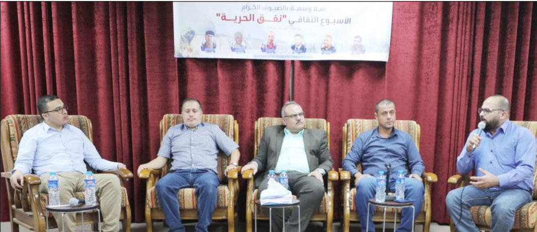
جانب من الصالون السياسي