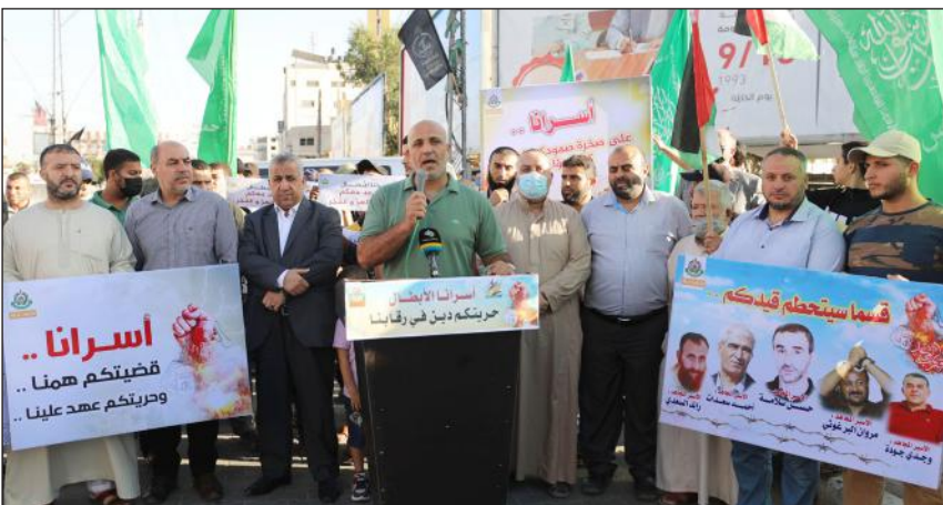
مسيرة لحماس وسط غزة في ذكرى وفاء الأحرار