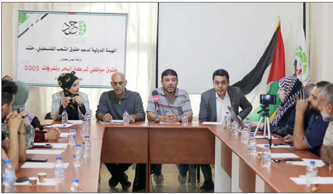
جانب من ورشة العمل بمدينة غزة أمس

منهم لدى السلطة الفلسطينية في عهد سلام فياض لم يُنفذ حتى اللحظة. تمييز جغرافي بينما أكد رئيس الهيئة الدولية لدعم حقوق الشعب الفلسطيني "حشد" صلاح عبد العاطي أن قطاع غزة يتعرض لعقوبات قائمة على تمييز جغرافي طالت المؤسسات الوطنية بن فيها أبناء تفرغيات 2005م. ولفت عبد العاطي إلى أن المساس بحقوق موظفي 2005 جاء رغم أن كل مسوغات تعيينهم في السلطة مكتملة، "لكن السلطة تنكرت لهم وقطعت رواتب عدد كبير منهم ثم صرفت مبلغاً محدوداً لهم، ولم تعتمد رتبهم العسكرية ومسوغات تعيينهم". وقال: "هنالك قرابة 8000 موظف معين منذ 2005، تعرضت حقوقهم للانتهاك طيلة 16 عاماً مضت عبر صرف رواتب مقطوعة لهم تبلغ أقل من الحد الأدنى للأجور، وعدم تثبيتهم، فمطلبهم الاعتراف بهم كموظفين رسميين حق لهم وليس منة من الرئيس ولا مجلس الوزراء". وبيّن أن الجريمة التي ارتكبتها حكومة سلام فياض ظلت تتكرر مع باقي الحكومات التي تلتها، "ليعيشوا سنوات طويلة من الألم، ولم تبق طريقة إلا ووصلت بها أصواتهم للمسؤولين، لكن للأسف الشديد إنكار العدالة هو المنهج ولم يجنوا سوى وعود متكررة لم تُنفذ". وخطب النظام السياسي وعلى رأسه رئيس السلطة بضرورة إيقاف الجريمة بحقهم وإعادة حقوقهم وحقوقي موظفي "مؤسسة البحر" الذين وجدوا أنفسهم بلا رواتب لقصور في إجراءات السلطة بإعادة هيكل المؤسسة.