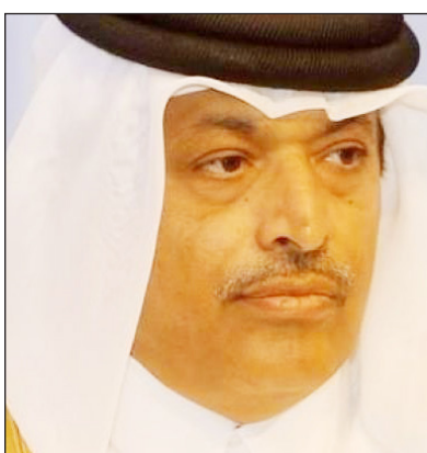
حسن بن عبد الله الغانم

الدوحة/ الجزيرة نت: انتخب أعضاء مجلس الشورى القطري، أمس، حسن بن عبد الله الغانم كأول رئيس لبرلمان منتخب بالبلاد، فيما انتخبت الدكتورة حدة السليطي نائبة له، حيث حصلت على أصوات 27 عضواً. وحصل الغانم على 37 صوتاً مقابل 8 لمبارك بن مطر الكواري، من مجموع أصوات أعضاء مجلس الشورى 45. وافتتح، أمس، أمير قطر الشيخ تميم بن حمد آل ثاني الجلسة الأولى للمجلس. وفي الثاني من أكتوبر/تشرين الأول