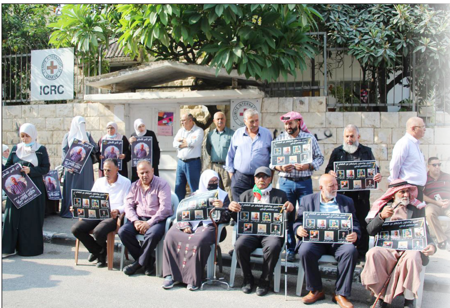
وقف تزامنية مع الأسرى في سجون الاحتلال أمام مقر الصليب الأحمر بطولكرم (فلسطين)