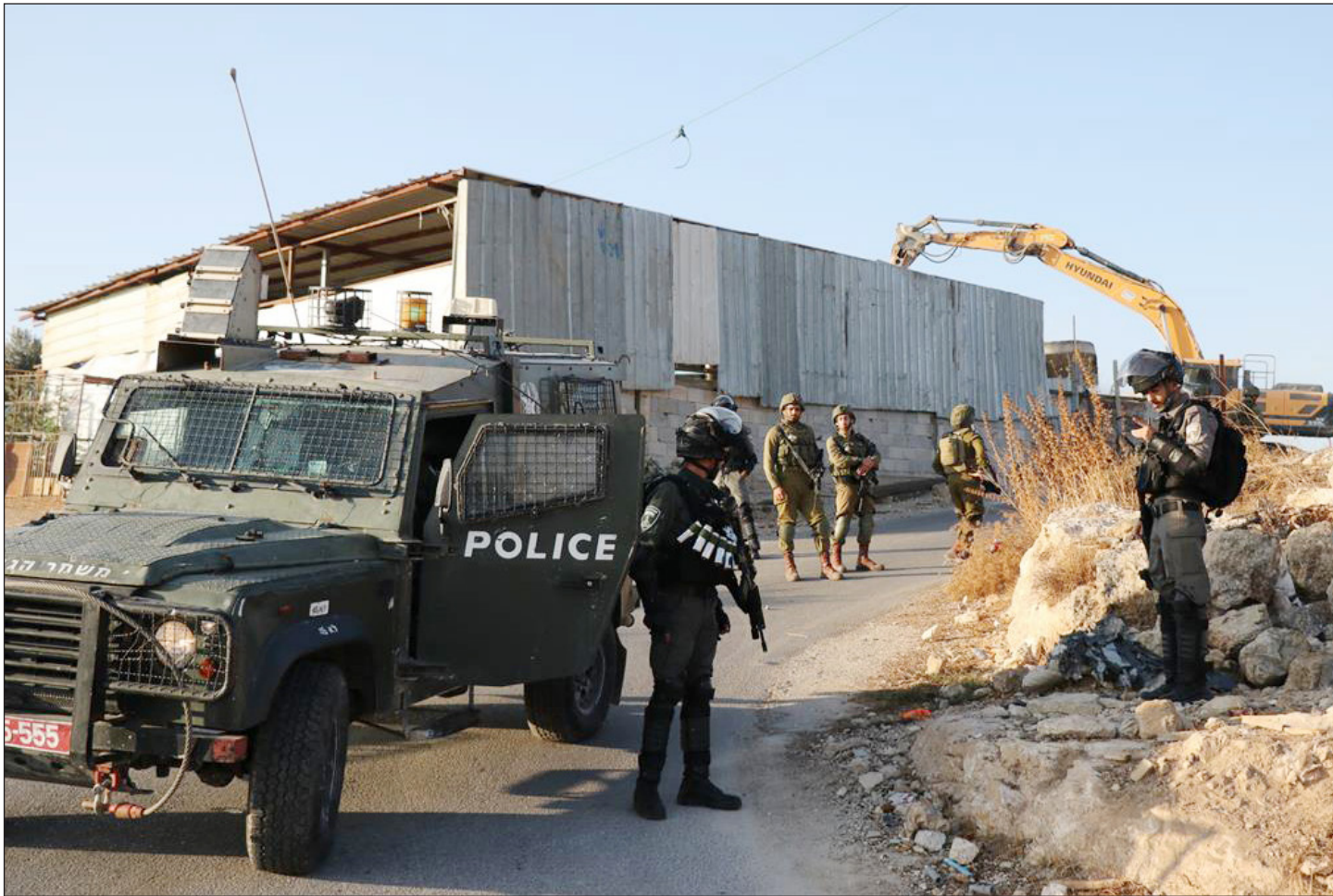
قوات الاحتلال تهدم 4 محال تجارية قيد الإنشاء في قرية دير قديس غرب رام الله (فلسطين)