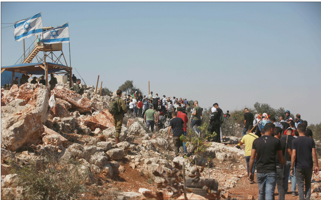
مواطنون في قرية بيتا يتحدون الاحتلال ويصلون إلى أراضيهم المهدة بالمصادرة لقطف ثمار الزيتون أمس (الأناضول)

أهالي بيتا يتحدون الاحتلال ويقطفون الزيتون بجبل صبيح