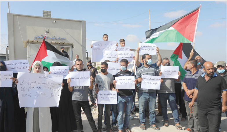
جانب من الوقفة الاحتجاجية جنوب قطاع غزة أمس

ويشترط الاحتلال للسماح بتصدير البندورة من غزة، نزع الغطاء الأخضر للبندورة (القمعة) عن كل حبة تصدّر، وهو ما يرفضه المزارعون والمصدرون. وردد المتظاهرون، هتافات تندد بعراقيل الاحتلال وشروطه التعجيزية التي يضعها أمام السلع الزراعية، مطالبين الأمم المتحدة والمؤسسات والجهات الدولية والغربية، للوقوف عند مسؤولياتها لإجبار الاحتلال على رفع القيود عن تسويق وتصدير