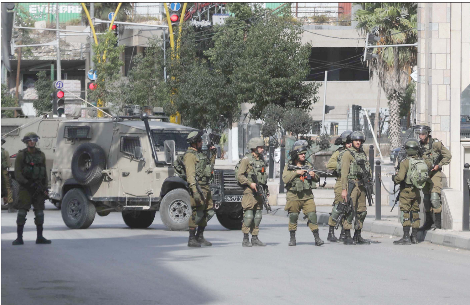
قوات الاحتلال الإسرائيلي تقتحم مدينة الخليل المحتلة عقب مسيرات داعمة للأسرى أمس