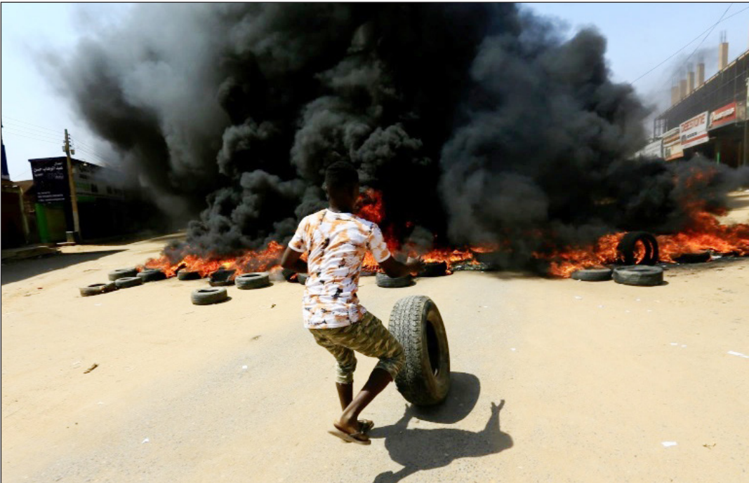
المعتصمون أغلقوا عدداً من الطرق الرئيسية في الخرطوم

وقال فيلتمان خلال اللقاء الذي تم بحضور نائب رئيس مجلس السيادة محمد حمدان حبيدتي إن التباينات في مواقف القوى السياسية، هي السبب في تأخير تشكيل المجلس التشريعي والمحكمة الدستورية ومفوضية الانتخابات وهيكل العدالة الانتقالية ومجلس القضاء العالي. وأكد المبعوث الأميري أن الانتقال لن يتم بصورة آمنة من دون إنشاء هذه المؤسسات. من جانبه، أكد البرهان -وفقاً للبيان- على ضرورة العودة إلى منصة تأسيس قوى الحرية والتغيير، والاحتكام للوثيقة الدستورية واتفاقية جوبا. ودعا البرهان إلى ضرورة توسيع المشاركة السياسية لكل القوى الوطنية ما عدا حزب المؤتمر الوطني المحلول، وقال إنه لا يمكن احتكار الحكومة التنفيذية بواسطة أحزاب بعينها لا تمثل كل أطراف الشعب السوداني، وفقاً للبيان.