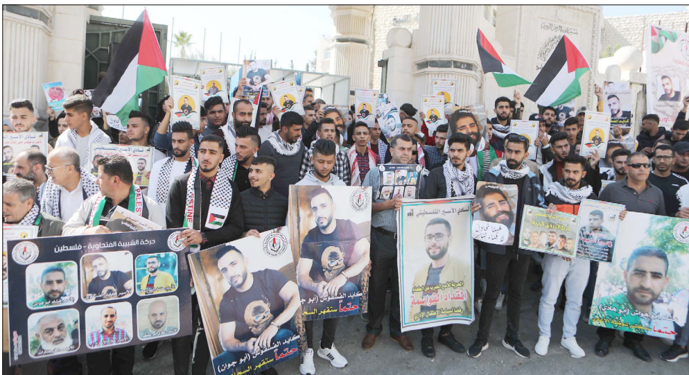
وقفة تضامنية بمدينة الخليل مع الأسرى في سجون الاحتلال أمس

رام الله/ فلسطين: أكد نادي الأسير، أن قوات القمع التابعة لإدارة سجون الاحتلال، اقتحمت أمس، قسم (21) في سجن "عوفر"، وأجرت عمليات تفتيش واسعة فيه. وأضاف نادي الأسير في بيان، أن مواجهة جرت بين أحد