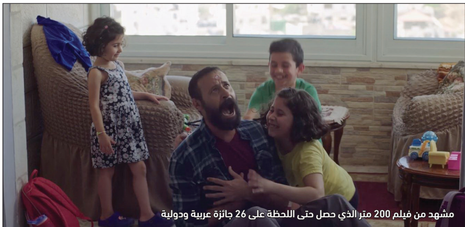
مشهد من فيلم 200 متر الذي حصل حتى اللحظة على 26 جائزة عربية ودولية