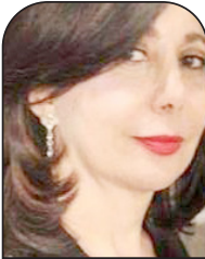
لميس أندوني العربي الجديد

لكن أهم أسلحة إدارة بايدن للعودة إلى خديعة السلام "الاقتصادي" الذي كان أول من بشر به في منتصف الثمانينيات وزير الخارجية الأميركي في حينه،