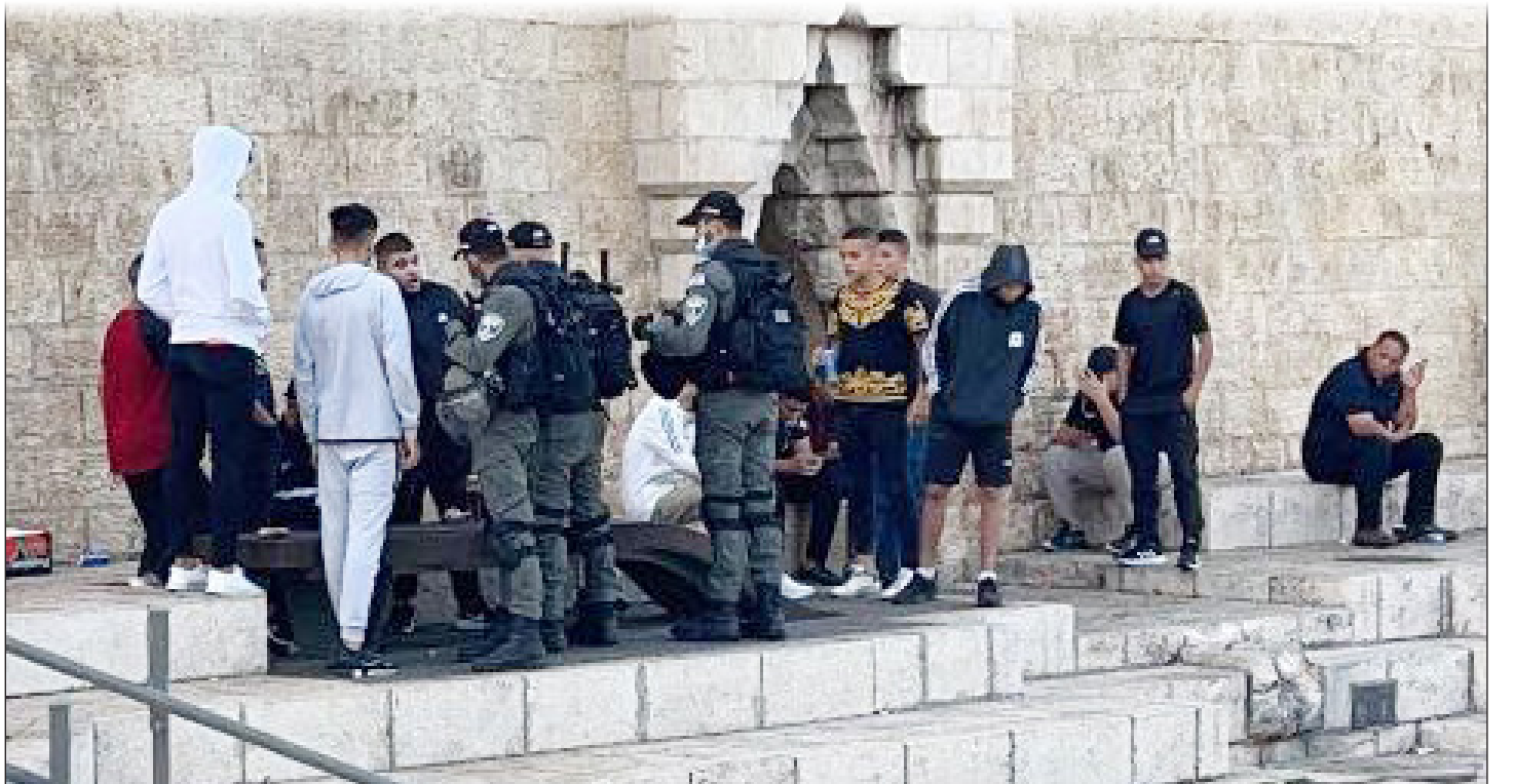
قوات الاحتلال تقمع المواطنين الموجودين في محيط باب العمود بالقدس المحتلة وتعتدي عليهم أمس (فلسطين)