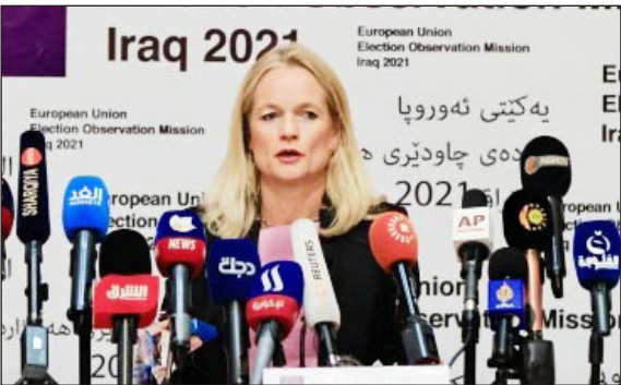
فيولا فون كرامون في متابعة إجراء الانتخابات العراقية

العراقيين. وأخيرا، أعلنت مفوضية الانتخابات أن ما يصل إلى 600 مراقب من خارج البلاد سيتولون مراقبة الانتخابات المبكرة. وفق أرقام المفوضية، في 31 يوليو/تموز الماضي، فإن 3249 مرشحا يمثلون 21 تحالفا و109 أحزاب، إلى جانب مستقلين، سيتنافسون للفوز بـ 329 مقعدا في البرلمان العراقي. وكان من المفترض انتهاء الدورة البرلمانية الحالية عام 2022، إلا أن الأحزاب السياسية قررت إجراء انتخابات مبكرة بعدما أطححت احتجاجات شعبية واسعة بالحكومة السابقة، برئاسة عادل عبد المهدي، أواخر 2019. وتم منح الثقة لحكومة برئاسة مصطفى الكاظمي، في مايو/ أيار 2020، لإدارة مرحلة انتقالية، وصولا إلى إجراء الانتخابات المبكرة. ومن المقرر عقد الانتخابات الشهر المقبل، حيث سيعدى نحو 25 مليون ناخب للاختيار من بين 3249 مرشحا يتنافسون على 329 مقعدا في البرلمان.