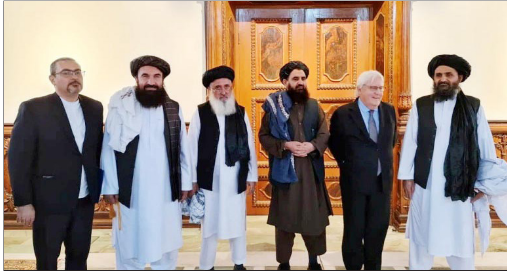
ديبورا ليونز مع قيادة طالبان

وذكرت وسائل إعلام أفغانية أن الاجتماع أكد أيضا على ضرورة اعتراف الأمم المتحدة بالحكومة الجديدة في أفغانستان والتعاون معها. وأشارت قناة "طلوع نيوز" المحلية إلى أن الاجتماع ناقش أيضا "تصفية القائمة السوداء للأمم المتحدة، وتنفيذ اتفاق الدوحة للسلام، والإفراج عن العملة الأفغانية المجمدة من أجل التنمية المصرفية والاقتصادية". وأضافت القناة أن الحكومة الجديدة تصر على أن الولايات المتحدة ما زالت ملتزمة باتفاق الدوحة، ويتعين عليها رفع العقوبات عن المسؤولين الحكوميين. وفرضت العقوبات الدولية عام 1999 عندما كانت طالبان تتولى السلطة في كابل.