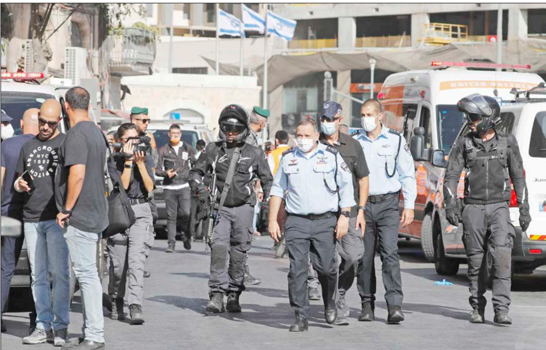
قوات الاحتلال تعين مكان تنفيذ العملية في القدس المحتلة

رام الله/ فلسطين: تصاعدت أعمال المقاومة في الضفة والقدس المحتلتين، ضد قوات الاحتلال الإسرائيلي ومستوطنيه، منذ انتزاع ستة من الأسرى حريتهم من سجن "جلبوع". ورصد المكتب الإعلامي لحركة المقاومة الإسلامية حماس في الضفة، في تقرير، أمس، 641 عملاً مقاوِماً في 123 نقطة مواجهة بمناطق متفرقة من الضفة والقدس المحتلتين منذ عملية "نفق الحرية". وأوصى التقرير 193 مواجهة مع قوات الاحتلال، والمشاركة في 170 تظاهرة تضامناً ونصرة للأسرى. وتخللت المواجهات والمظاهرات 175 عملية إلقاء حجارة، و21 إلقاء زجاجات حارقة، و50 إلقاء مفرقات نارية، و20 عملية تحطيم أدوات أو آليات عسكرية، و13 عملية حرق أماكن أو منشآت عسكرية، وإسقاط طائرتي "درون"، و150 عملية مقاومة لاعتداءات المستوطنين. وسجل التقرير 4 عمليات طعن أو محاولات طعن، وإلقاء 8 عبوات ناسفة، عدا عن 8 فعاليات للإبراك الليلي في بلدتي بيتا وبيت دجن بنابلس. وأفاد بارتفاع عمليات إطلاق النار التي بلغت 25 عملية إطلاق نار، استهدف المقاومون خلالها نقاطاً مختلفة لقوات