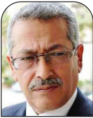
حمي الأسمر العربي الجديد

حين تنتصر «دولة» على فرد أو أفراد فهذا طبيعي، أما حين «ينتصر» فرد على دولة فتلك هي المعجزة، وقد حقق الستة معجزتهم، وأعادوا وضع قضية الأسرى التي كثيراً ما تُنسَى على رأس الأولويات الفلسطينية، وتمكّنوا من وضعها في مقبيل كل نشرات الأخبار، وأصبحت الشغل الشاغل لمنصّات التواصل الاجتماعي.