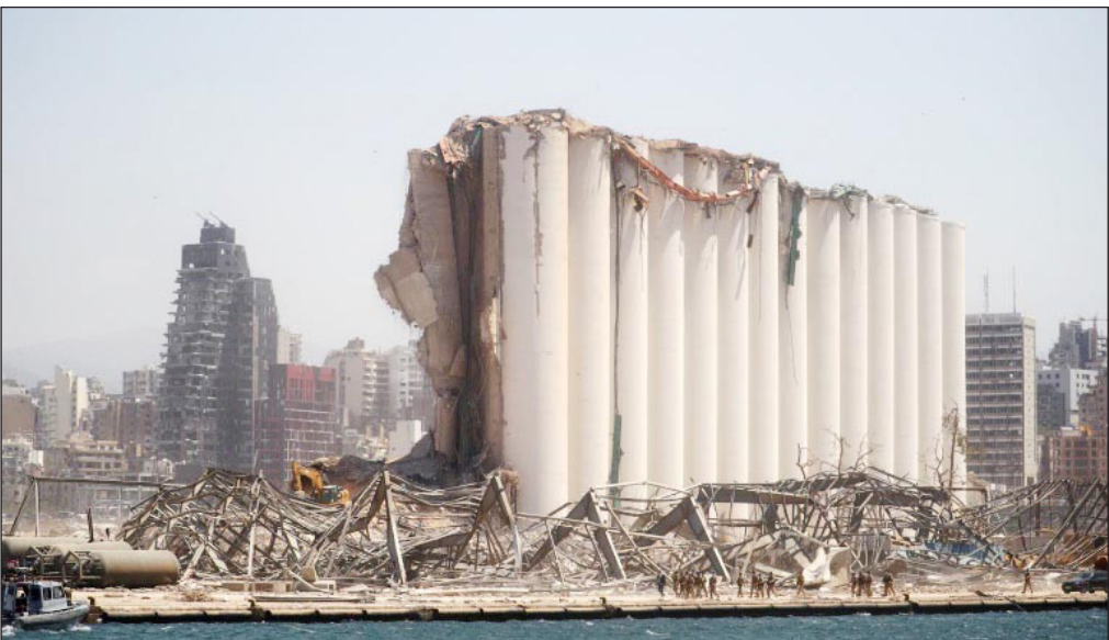
مرفأ بيروت بعد الانفجار (أرشيف)

ومند وقوع الانفجار، رفضت السلطات تحقيقا دوليا، لكن محققين فرنسيين وأميركيين شاركوا في التحقيقات الأولية بشكل مستقل.