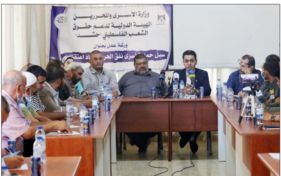
ورشة عمل تبحث سبل حماية الأسرى الفلسطينيين المعاد اعتقالهم في غزة أمس