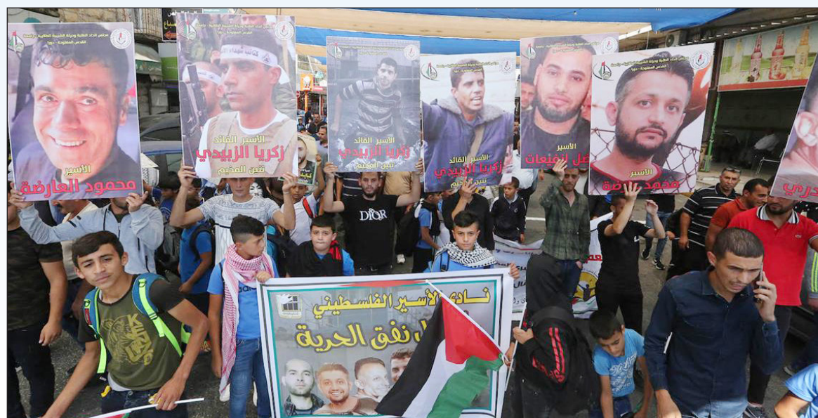
مسيرة في الخليل تضامناً مع الأسرى في السجون (فلسطين)