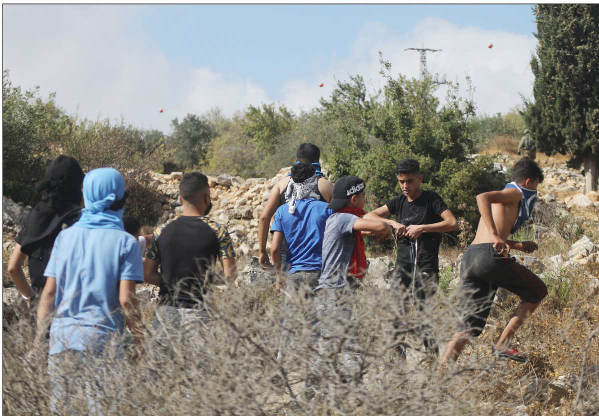
مواجهات بين شبان وقوات الاحتلال عقب مسيرة منددة بالإجراءات العقابية بحق الأسرى على مدخل بلدة سغير

مسؤولون إسرائيليون: لن نوافق على الإفراج عن «السة» بصقعة تبادل