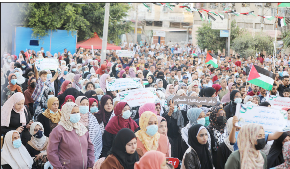
جانب من المؤتمر بمدينة غزة أمس