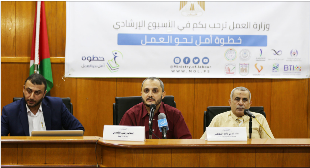
جانب من انطلاق أسبوع «خطوة أمل نحو العمل» في غزة أمس

وأكد وجود عدة مشاريع تعمل عليها الجامعة حالياً من أجل تشغيل الخريجين مع جهات دولية، مشيراً إلى أن دائرة التدريب بالجامعة دربت آلاف المتدربين لمساعدتهم في تطوير قدراتهم. وشدد على اهتمام الجامعة بالعمل عن بعد لكونه يفسح المجال أمام الخريجين للعمل في ظل الظروف الاقتصادية الصعبة التي يمر بها منذ 15 عاماً. ودعا الجماصي وزارة العمل للإيفاء بوعدها بالعمل على موامة القوانين الفلسطينية لتتلاءم مع العمل عن بعد، ما يفسح المجال أمام الخريجين للحصول على فرص عمل تتواءم مع قدراتهم.