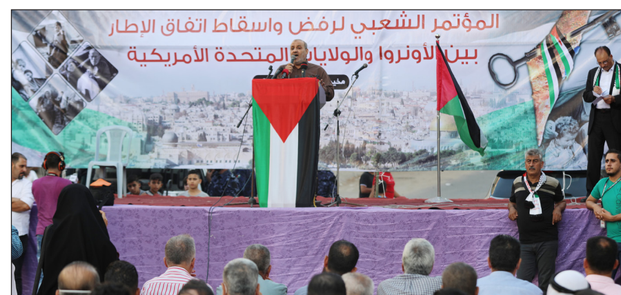
مؤتمر شعبي لرفض اتفاق الإطار بين أونروا والولايات المتحدة الأمريكية

غزة/ نور الدين صالح: أكدت القوى الوطنية والإسلامية والفعاليات الشعبية، رفضها اتفاقية الإطار التي وقعتها وكالة غوث وتشغيل اللاجئين الفلسطينيين "أونروا" مع