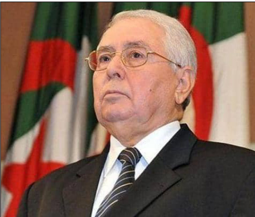
عبد القادر بن صالح