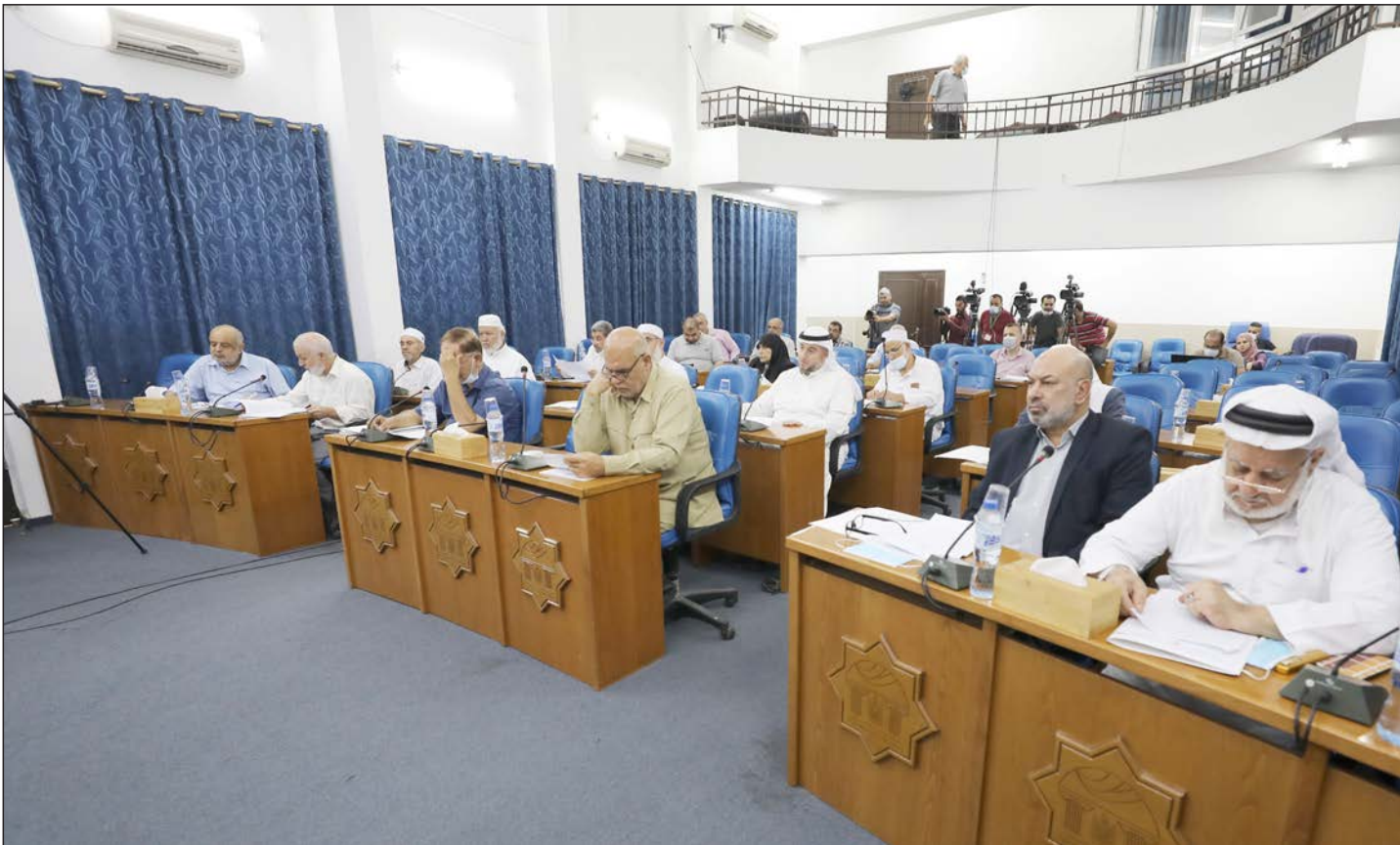
نواب المجلس التشريعي في أثناء الجلسة البرلمانية بمدينة غزة أمس

وطالب الأمم المتحدة والدول المانحة بتحمل مسؤولياتها تجاه معالجة الأزمة المالية التي تعانيها