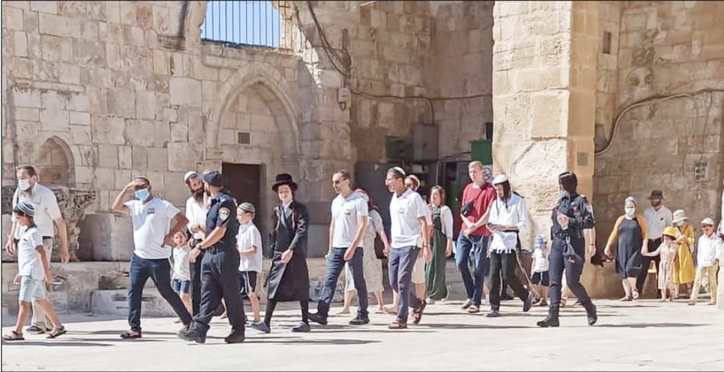
مستوطنون يقتحمون باحات المسجد الأقصى المبارك (فلسطين)

المشددة، وإغلاق للمحلات التجارية وعرقلة وصول المقدسين إلى الأسواق، بحجة الأعياد اليهودية. وبين أن المدينة أصبحت فارغة لا يوجد فيها أي حركة تجارية، ما يؤثر في الوضع الاقتصادي الذي يعاني الأمرين بسبب الاحتلال وإجراءاته الممنهجة. وتابع: "لأسف كل عام يأتي يكون أصعب وأسوأ على القدس والأقصى، من حيث انتهاكات الاحتلال وممارساتها، والتي تزداد وحشيتها وتكون أشد قسوة ومؤلمة، في ظل حالة التراخي والصمت العربي والإسلامي إزاء ما يجري". وأكد أهمية الوصاية الأردنية على المقدسات، وضرورة التحرك العاجل لوقف انتهاكات الاحتلال بحق المسجد الأقصى.