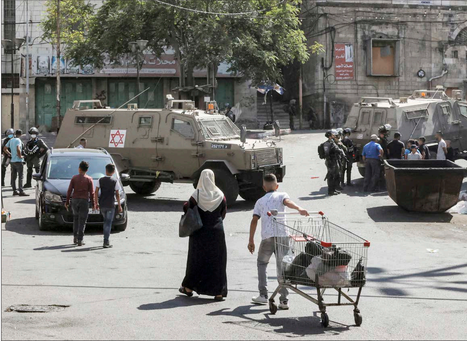
قوات الاحتلال تغلق وسط مدينة الخليل بالضفة الغربية بحجة الأعياد اليهودية

الزعارير: السلطة تحاول إقناع الرأي العام بأنها تمارس الديمقراطية