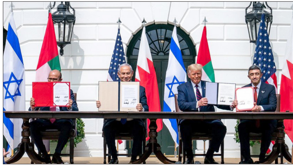
التوقيع على اتفاق التطبيع بين الإمارات والبحرين ودولة الاحتلال برعاية أمريكية (أرشيف)