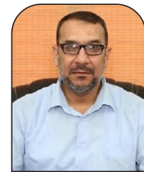
لواء متقاعد/ محمد عبد الله لفي

ما زالت عملية نفق الحرية للأسرى الستة تتفاعل ولم تنته بعد، فبعد مرور أسبوع كامل على العملية، وعلى الرغم من إعادة اعتقال أربعة منهم، فإن اثنين منهم ما زالوا طليقين، ومع كل دقيقة تمر دون اعتقالهما تعد إنجازاً يضاف إلى سجل هؤلاء الأحرار في مواجهة منظومة الاحتلال الأمنية. وفي تقديري أنه وبعد أسبوع من الحدث، وإعادة اعتقال أربعة، وفشل اعتقال الاثنين الآخرين، هي لحظة مناسبة للحديث عن الحادثة، لتأكيد أن أي محاولة يقوم بها أسرى فلسطينيون لانتزاع حريتهم، هي عملية محفوفة بالمخاطر، ومتوقع إعادة اعتقالهم أو نجاحهم في نيل حريتهم، وهذا هو الحاصل حتى اللحظة. وبداية يجب التأكيد أن كل عملية يقوم بها الأسرى الفلسطينيون، هي عملية فدائية من لحظة عقد العزم والتفكير في الخروج من السجن، لأنها عملية تحد للمنظومة الأمنية الإسرائيلية، فنجاح الأسرى ابتداءً يتحقق من لحظة اتخاذ القرار بغض النظر عن نتائج العملية سواء بتمكين الأسرى من نيل حريتهم أو إعادة اعتقالهم أو استشهادهم. وبعد الاطلاع على كل المعلومات التي تم تناولها خلال هذه العملية، يمكن أن نسردها هنا مختصراً لما تم من أحداث تم التأكد من صحتها: فقد اختار الأسرى الستة فجر الاثنين 6/9/2021، توقيتاً مناسباً لتنفيذ عملية الهرب، إذ تبدأ إجازة رأس السنة العبرية من مساء هذا اليوم، وقد تم بدء الحفر في النفق من قبل عدة شهور مضت، من أسفل الحمام الموجود في الغرفة، وهي فكرة تم استخدامها من قبل أسرى سابقين سنة 2014 من ذات السجن -سجن جلبوع- كما أن فكرة استخدام حفر نفق تحت الحمام في غرفة المعتقلين تم تناولها في مسلسل تلفزيوني أذاعته فضائية الأقصى التابعة لحركة حماس سنة