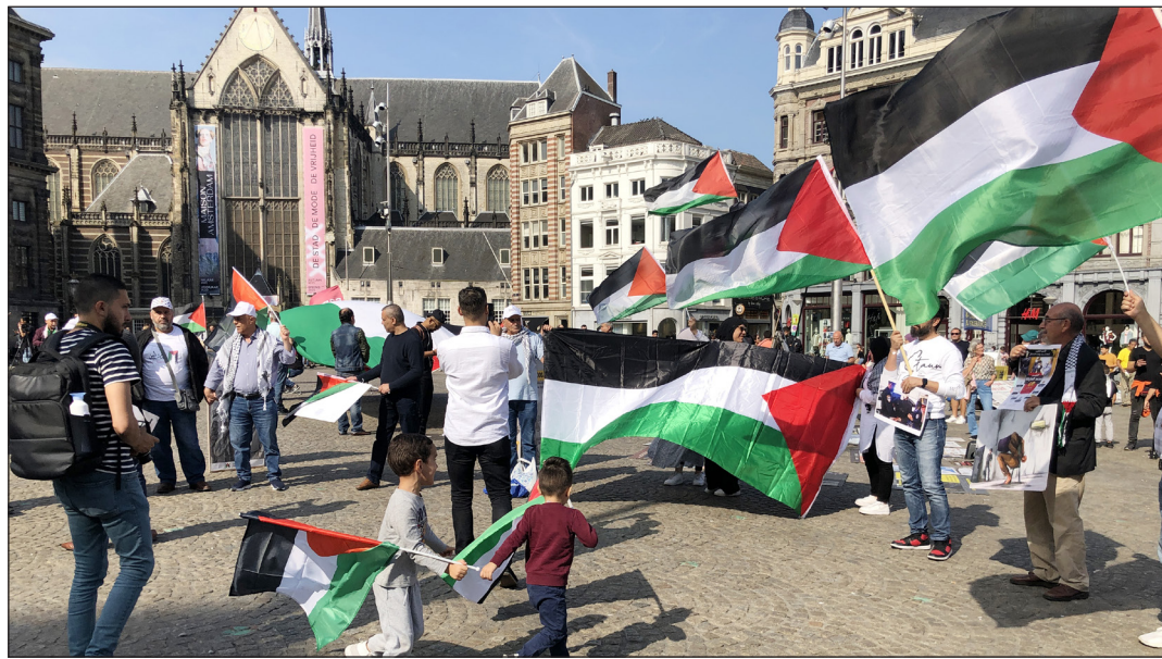
جانب من فعالية في هولندا دعماً للأسرى في سجون الاحتلال

نظمت أمام مقر سفارة دولة الاحتلال الإسرائيلي، الحكومة الإسبانية والاتحاد الأوروبي، بالضغط على الاحتلال للإفراج الفوري عن الأسرى، خاصة الأطفال والنساء والمعتقلين الإداريين.