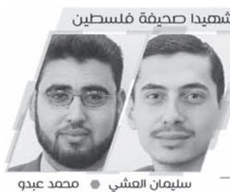
شهيداً صحيفياً فلسطينياً

قررت "لجنة المتابعة العليا للجماهير العربية"، إحياء الذكرى الـ 21 لهبة القدس والأقصى، يوم السبت المقبل، بمظاهرة قطرية تجري في مدينة سخنين وتسبقها زيارة أضرحة الشهداء الـ 13 والنصب التذكارية. جاء ذلك خلال ندوة سياسية، بُثت على شبكة التواصل الاجتماعي وتطبيقات "زوم"، أمس، نظمتها التجمع الوطني الديمقراطي في قرية البعنة بمنطقة الجليل، إحياء لذكرى هبة القدس والأقصى الـ 21. واستهلّت الندوة بالوقوف دقيقة صمت لإجلال وإكباراً للشهداء الأبرار وقراءة سورة الفاتحة على أرواحهم. وقال النائب عن التجمع الوطني الديمقراطي في القائمة المشتركة سامي أبو شحادة، إنه "في كل عقدين من الزمن نشهد حالة من مواجهة الجدية من حيث تعامل المؤسسة الإسرائيلية مع جماهير شعبنا كأعداء، بدءاً من النكبة ومروراً بيوم الأرض وهبة القدس والأقصى وصولاً إلى هبة الكرامة في أيار/ مايو الماضي". وأكد أبو شحادة أن شرارة هبة القدس والأقصى كانت في إثر اقتحام وانتهاك حرمة المسجد الأقصى حينها، وهو أشبه بما حدث في الهبة الشعبية الأخيرة، وفي ذلك الحين خرجت جماهير شعبنا في مناطق الـ 48 إلى الشوارع بأعداد كبيرة في جزء لا يتجزأ من الشعب الفلسطيني، وخلال عدة أيام ارتقى 13 شهيداً من أراضي الـ 48، في حين أصيب المئات منهم. وأشار إلى أن لجنة "أور" التي كُلفت بالتحقيق في أحداث هبة القدس والأقصى -مع كل انتقاداتنا عليها ومطالبتنا بلجنة تحقيق مستقلة- أكدت من خلال تقرير لها أن أجهزة الأمن وشرطة الاحتلال تعاملت مع فلسطينيي الأراضي المحتلة بصفتهم أعداء، "وبرغم هذا الاستنتاج وانتهاكات حقوق الإنسان وقتل الشهداء لم يحاسب أحد".