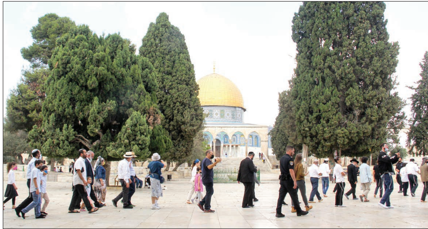
مستوطنون يقتحمون باحة المسجد الأقصى بحماية جيش الاحتلال الإسرائيلي أمس

قال خطيب المسجد الأقصى الشيخ عكرمة صبري: إن الاحتلال الإسرائيلي يسارع لبسط سيطرته على المسجد الأقصى، مشيراً إلى أن رفع علم دولته المزعومة وأداء الطقوس التلمودية والنفخ في البوق داخل المسجد بدأت تطفو على السطح بذريعة الأعياد اليهودية. وعدّ صبري في تصريح صحفي أمس