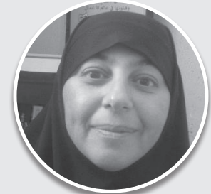
د. زهرة حدرد كاتبة وروائية فلسطينية

"حبيبتني، لما يتزوج رح ينسلك.. اكسي وجوده معك هلا.. بكرة بنت الحلال بتاخذه منك.. والله أعلم كل قديش رح يبجي يشوفك وتشوفيه"، رسالة تحذيرية تطلقها النساء بينهن، في حين تقول إحداهن: "ابني بطل ابني حتى يتزوج، وينتي بتظن بنتي لطول العمر". فهل حقاً ينسى الابن أهله وينطلق وراء شؤونه الخاصة بمجرد أن يتزوج، في الوقت الذي تبقى فيه البنت وقية لأهلها تهتم بشؤونهم وتتواصل معهم مهما بلغت مسؤولياتها وتضاعفت همومها؟ وإن احتاج لها أهلها في أي وقت، ألا تراها تسارع لمد يد العون والمساعدة؟ ناهيك برعاية والديها حين يرق عظمها ويضعف بصرها وتخور قواها ويصبحان طريحي الفراش؟ أرى أن نظرة المجتمع هذه تجاه الأبناء التي تعتمد على محاباة الإناث على الذكور بعد الزواج سلبية وغير منصفة حتى النخاع، فالأم تعد أن ابنها بعد زواجه تسرقه امرأة أخرى تستولي عليه وتنسيبه والديه وأهله، وكأن القضية قضية تملك، في حين تبقى البنت مرتبطة بأهلها، فتسحب معها زوجها وأبنائها