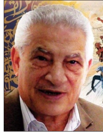
قاسم عبده قاسم

عصر سلاطين المماليك "التاريخ السياسي والاجتماعي"، ماهية الحروب الصليبية، سلسلة عالم المعرفة. مدرسة كبرى وكتب المفكر والكاتب الصحفي أنور الهواري، "حزنت جداً لسماع نبأ وفاة المؤرخ الجليل، أستاذنا العظيم دكتور قاسم عبده قاسم". وتابع من خلال منشور على صفحته الشخصية على "فيسبوك": "مدین لهذا الرجل بما علمني، وما تعلمته منه، من فصول العلم والأدب والأخلاق والهمة والرجولة والإنسانية والمروءة والشرف". وأضاف: "هو مدرسة كبرى في علمه وأخلاقه وثراء شخصيته، هو بكل المعايير- من نوابع هذا البلد، ومن أكابره وعظمائه".