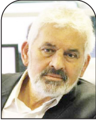
علي الصالح القدس العربي

مثل الاندحار من قطاع غزة بارقة أمل فلسطيني بإمكانية الاندحار الصهيوني من أراض فلسطينية إضافية، كما مثل هذا امتداداً للاندحار الصهيوني من جنوب لبنان في أيار 2000م والذي أضاء حينها طريقا جديدا للفلسطينيين في ظل فشل كامب ديفيد وانكفاء خيار المفاوضات وسقوط أوسلو وحصار عفرات بانطلاق انتفاضة الأقصى، كما رسخ الانسحاب منهجاً فلسطينياً جديداً فعلاً ومجدياً وهو المقاومة بكل أشكالها وعلى رأسها العمل العسكري، وأثبت هذا الاندحار الصهيوني عن توفر خيارات أمام الشعب