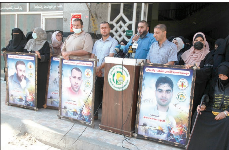
وقفة تضامنية نصره للأسرى بغزة أمس

غزة/ فلسطين: أعلن أسرى "حركة الجهاد الإسلامي" أمس، التمرد وعدم الاستجابة للفحص الأمني والتشخيص ضمن خطوات مقاومة ومواجهة كل مخططات إدارة سجون الاحتلال الوحشية بحقهم. وأوضحت مؤسسة "مهجة القدس للشهداء والأسرى" خلال كلمة لها في فعالية نظمتها بالتعاون مع الإطار النسائي في حركة الجهاد الإسلامي أمس في مدينة غزة، أن أسرى "الجهاد" يواصلون خطواتهم التصعيدية بالاعتصام في ساحات