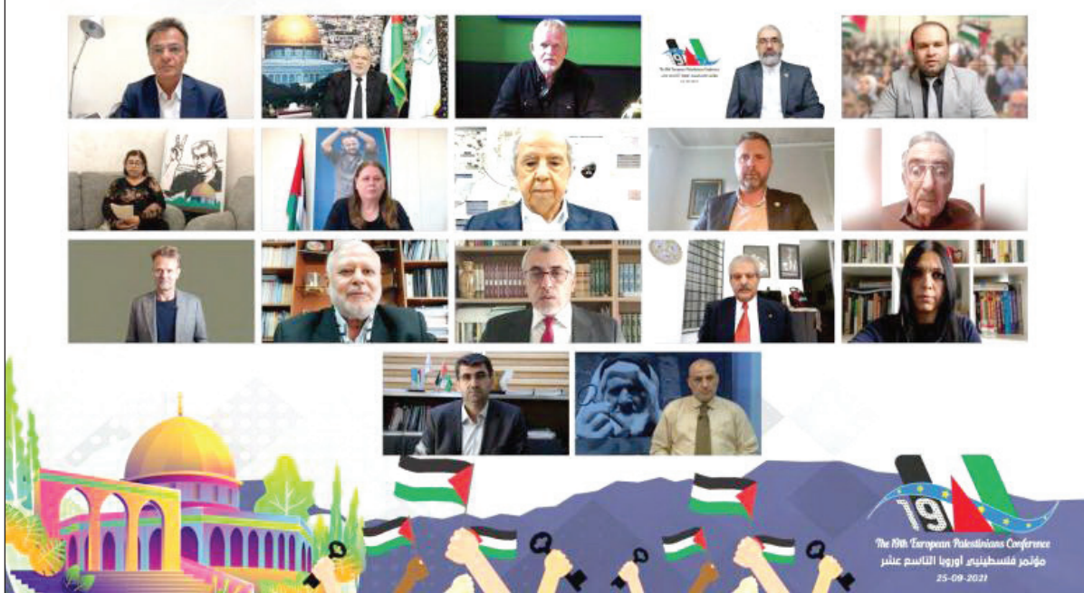
فماليات مؤتمر فلسطيني أوروبا الـ 19 بحضور فلسطيني وعربي وأوروبي عبر المنصات الرقمية نظراً لجائحة كورونا

في فعاليات مؤتمر "القدس توحدا والعودة موعدا"