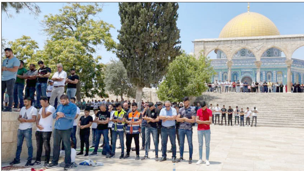
أداء صلاة الجمعة في باحات المسجد الأقصى المبارك أمس (فلسطين)

وذكرت دائرة الأوقاف الإسلامية أن 40 ألف مُصلٍّ من القدس والضفة الغربية والداخل الفلسطيني المحتل أدّوا صلاة الجمعة، واستنكر الشيخ يوسف أبو