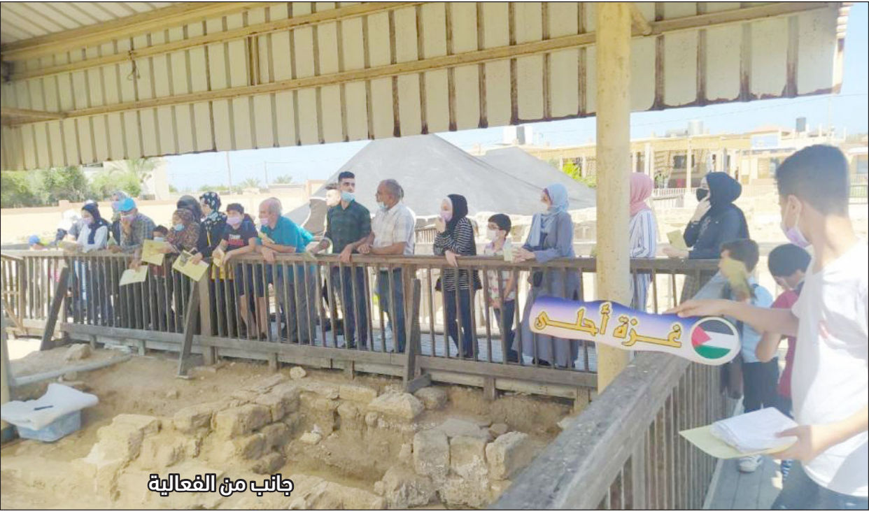
وأيام من الفعالية