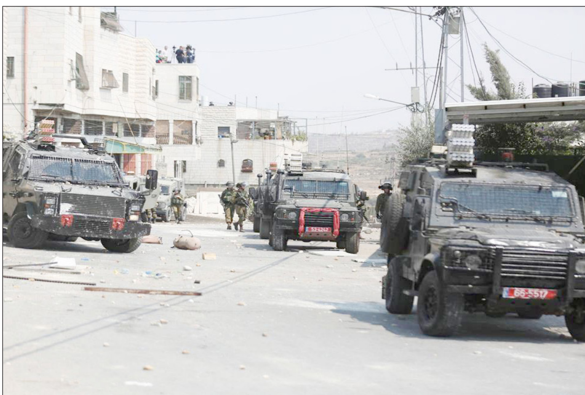
اقتحام قوات الاحتلال الإسرائيلي بلدة بيت أمر شمال مدينة الخليل أمس (فلسطين)