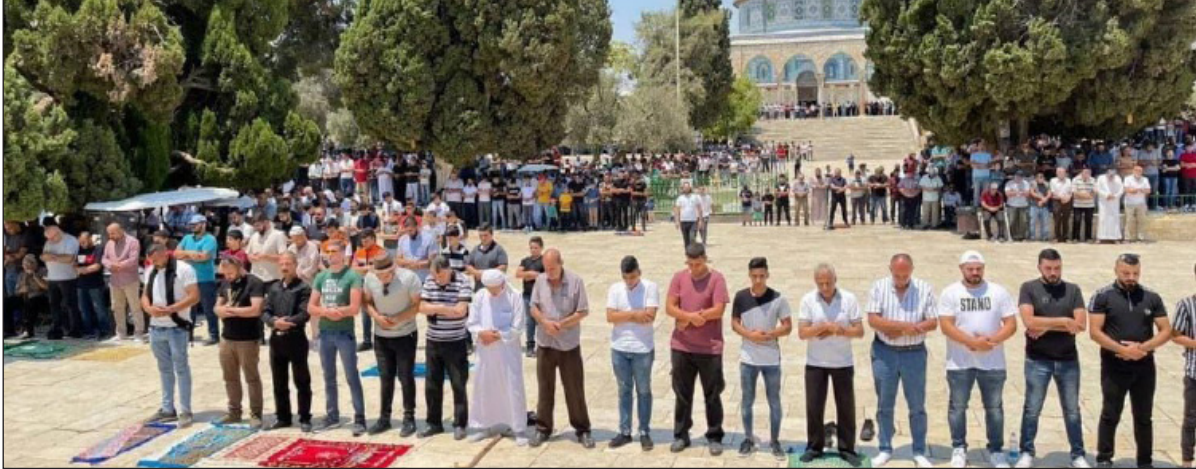
مواطنون يؤدون صلاة الجمعة في المسجد الأقصى أمس

الفقر، وحفلات السهر والنجوم والروابي إلى آخر الليل، كما يشكون انتشار الرذيلة والفاحشة والخيانة والقمار والمحرمات والخمور، واختلاط الرجال بالنساء في الأعراس".