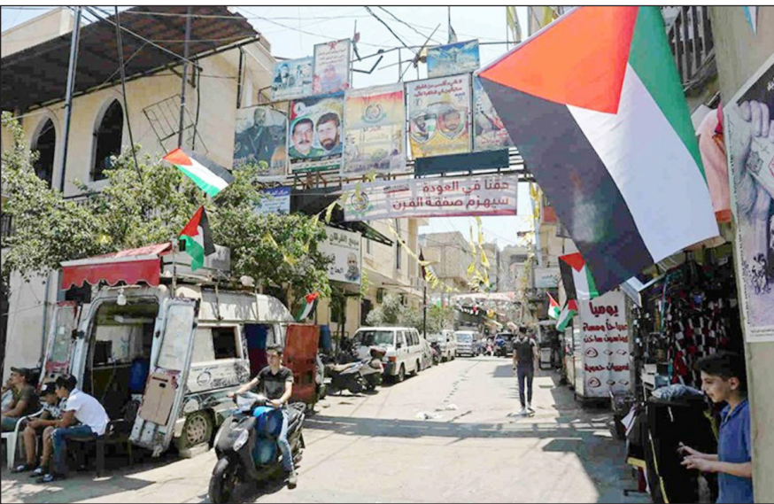
مخيمات الفلسطينيين في لبنان