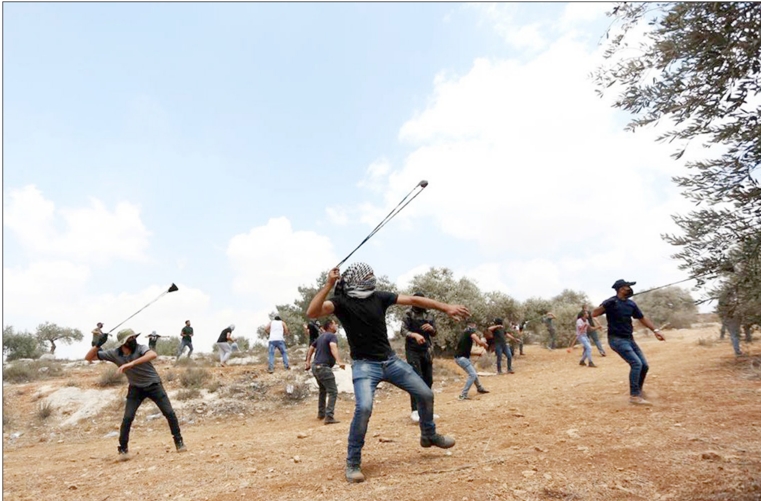
شبان فلسطينيون يلقون الحجارة على قوات الاحتلال في أثناء مواجهات جنوب مدينة نابلس أمس (فلسطين)

1 شيقل | العدد 5087 | 16 صفحة | WWW.FELESTEEN.PS