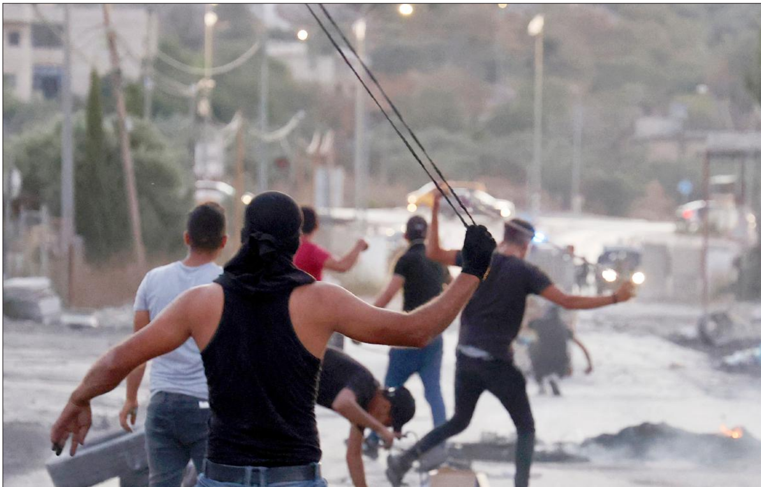
مواجهات بين شبان فلسطينيين وقوات الاحتلال في قرية بيتا بالضفة المحتلة (أ ف ب)