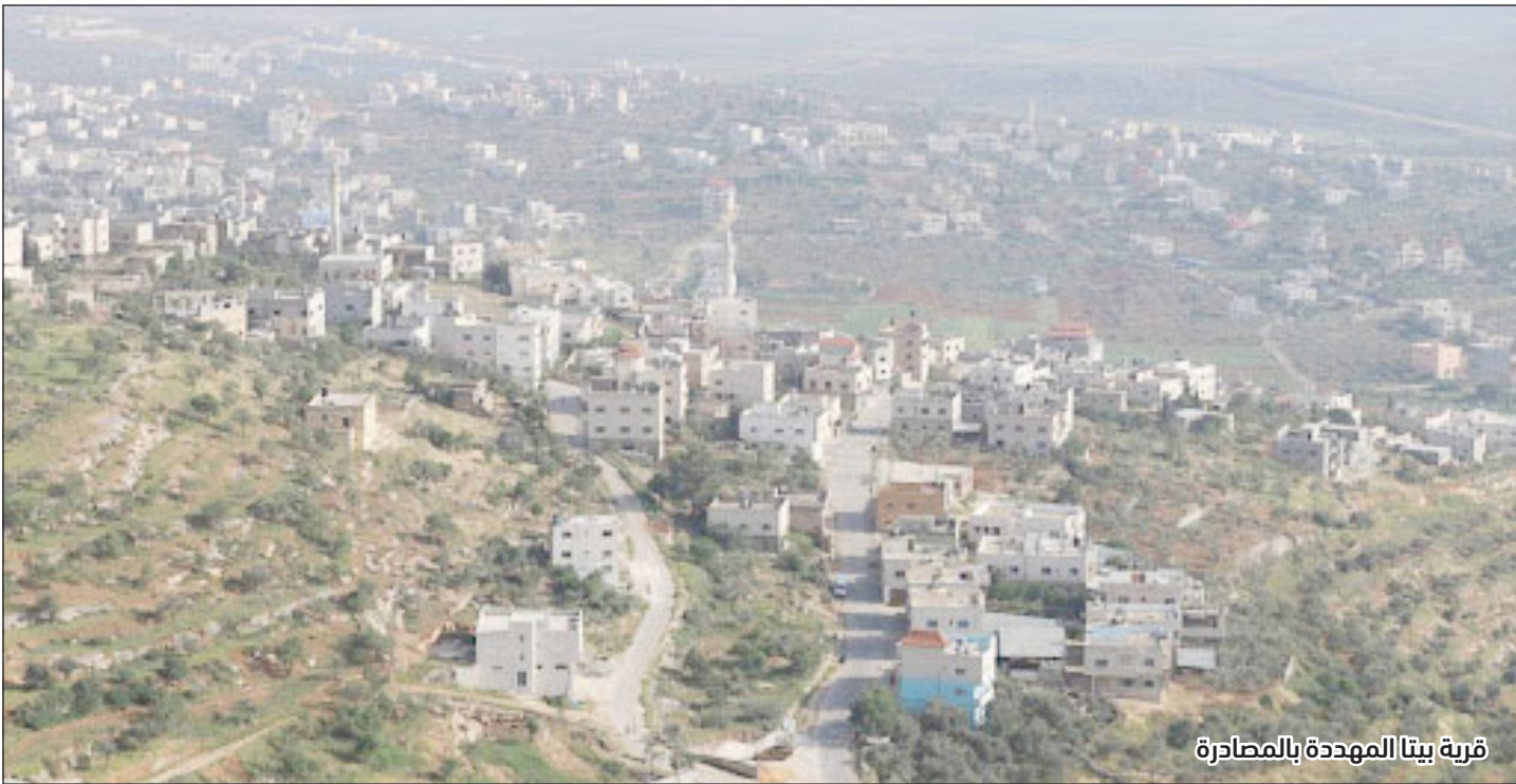
قرية بيتا المهدة بالمصادرة