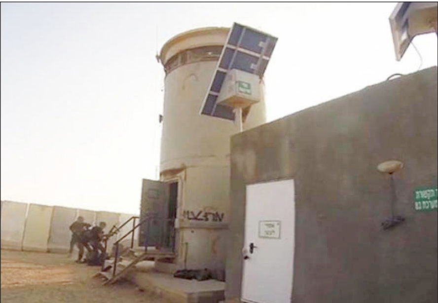
مشهد من عملية ناكل عوز البطولية (أرشيف)

ناجون من العملية، والتي شكلت ضربة للخطوط الخلفية لجيش الاحتلال في أثناء المعارك على حدود القطاع. ونقلت القناة عن اثنين من