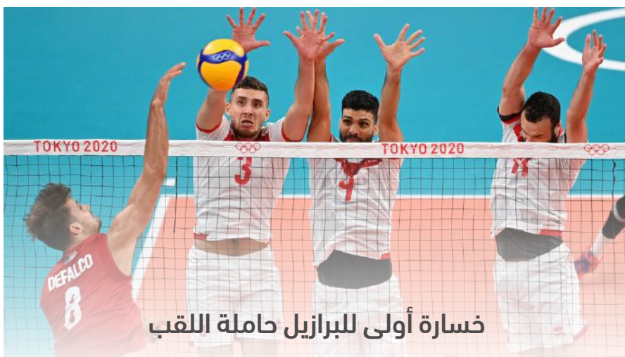
خسارة أولى للبرازيل حاملة اللقب

في المجموعة ليرفع رصيده إلى 4 نقاط، متفوقاً