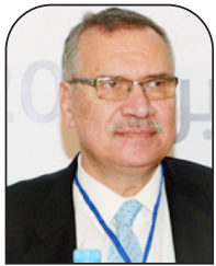
معين الطاهر العربي الجديد

وأختم المقال، بأنه لا توجد مقدسات، ولا مقولات قاطعة بهذا الشأن، وعلى الأمم والشعوب أن تصوغ نموذجها الخاص بواقعها، وأن تطور هذا النموذج بين الفينة والأخرى، وهي ملتصقة بوجوب تحقيق أهدافها بالحرية والتحرر والاستقلال.