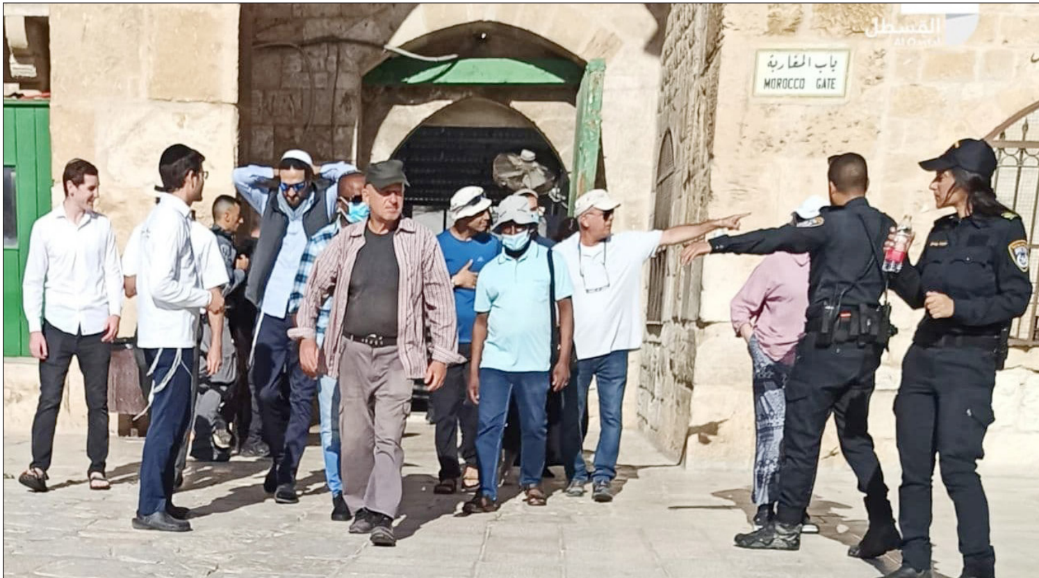
مستوطنون يتقدمهم الصحفي الإسرائيلي آرون سيجال يقتحمون المسجد الأقصى بحماية من شرطة الاحتلال أمس (فلسطين)

استشهد شاب مساء أمس متأثراً بجراحه التي أصيب بها برصاص قوات الاحتلال الإسرائيلي في مدينة الخليل جنوب الضفة الغربية المحتلة. وأعلنت وزارة الصحة استشهاد الشاب شوكت