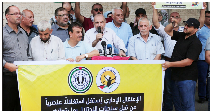
وقفة تضامنية مع الأسرى المضربين عن الطعام في سجون الاحتلال أمام مقر الصليب الأحمر بقرية أمس