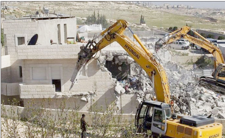
الاحتلال يجبر المقدسيين على هدم منازلهم تنفيذًا لمخططة التهويدي

وتحديثًا وبناء بزعم المحافظة على التراث المعماري، وهذا يمنع السكان من تطوير منازلهم وصيانتها. ونبه الهدي إلى أن بلدية الاحتلال تشترط على بعض البنايات والمؤسسات العامة بأن يُسيطر على الأرض المبنية عليها لتصبح مملوكة لها، ومن ثم نزع أي تبعية فلسطينية عليها، ومن ثم تحويلها لجمعية استيطانية. ويؤثر المشروع الاستيطاني في عشرات آلاف الفلسطينيين، وبخاصة في شوارع صلاح الدين والسلطان سليمان والزهراء، وأحياء، بينها الشيخ جراح ووادي الجوز، التي تعد عصب الحياة ومركز التجارة في مدينة القدس والبلدة القديمة. ويقول خبراء: إن المخطط يحدد سياسات البناء في المنطقة لسنوات طويلة قادمة، ما يؤثر في الوجود الفلسطيني في المنطقة.