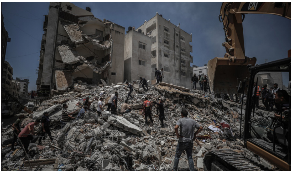
الجانب المصري لا يسمح بإدخال الحديد المسلح إلى غزة كذلك الحال مع الجانب الإسرائيلي "أي المصري بدخوله" والقول لأبو جياب. أبعاد سياسية

والدولية الرامية إلى تذليل العراقيل التي