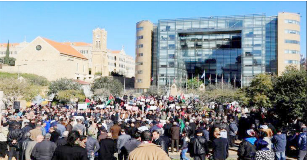
جانب من التظاهرة الاحتجاجية في العاصمة بيروت أمس