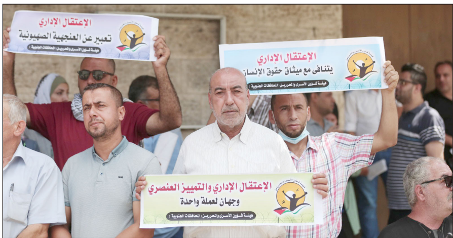
جانب من الوقفة التضامنية مع الأسرى بمدينة غزة أمس

مدار السنوات الماضية من خلال إضرابات فردية عن الطعام في وضع حد لاعتقالهم الإداري، وإجبار الاحتلال على إطلاق سراحهم. الجناحين المحتجزة في السياق ذاته، شاركت فعاليات جنين ونابلس، أمس، في وقفتي دعم وإسناد للأسرى المرضى والمضربين عن الطعام. وطالب المتحدثون في الوقفتين المؤسسات الدولية وعلى رأسها "الصليب الأحمر" بالعمل جديًا لإنقاذ الأسرى المضربين المرضى والضغط على سلطات الاحتلال من أجل الإفراج عنهم، وإنهاء ملف الاعتقال الإداري، واسترداد جثامين الشهداء المحتجزة في مقابر "الأرقام" والثلاجات الإسرائيلية.