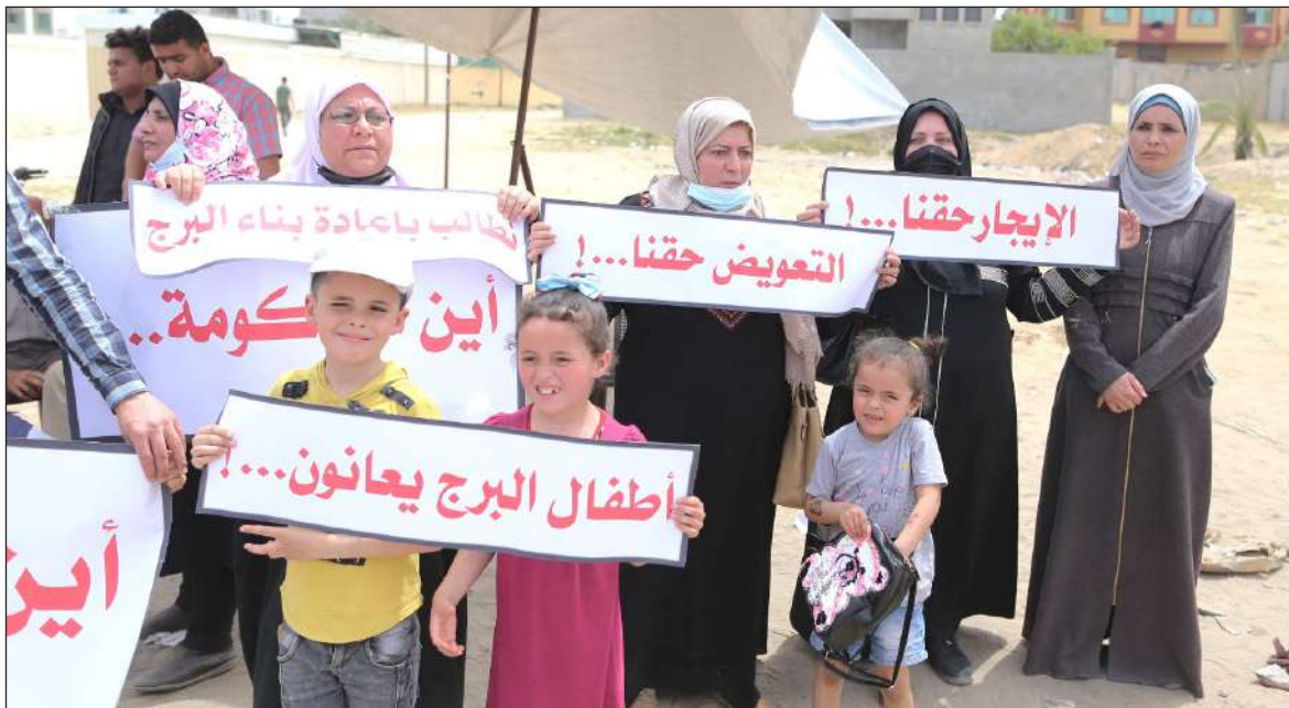
وقفة نظمها سكان برج القمر أمس