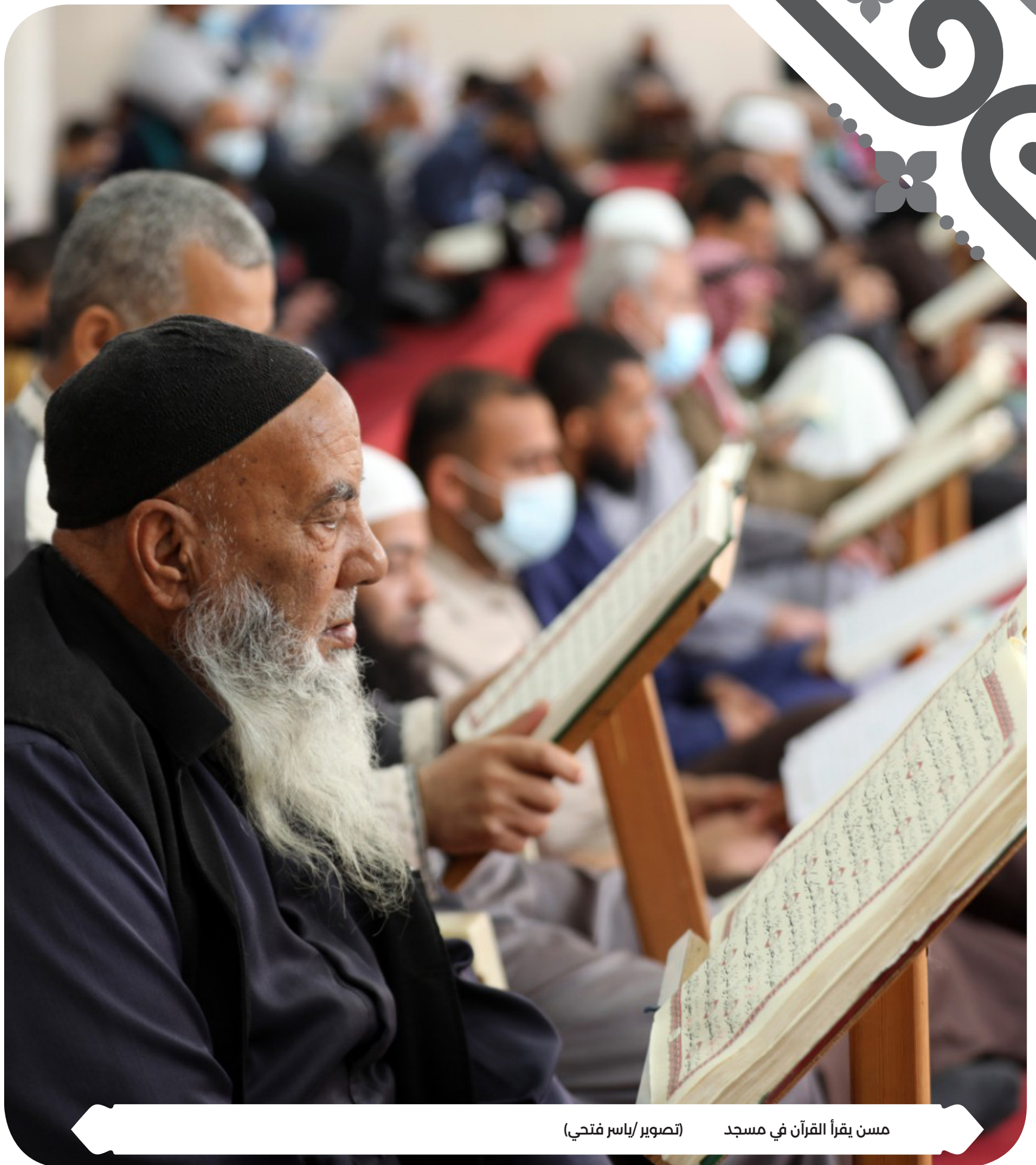
مسن يقرأ القرآن في مسجد