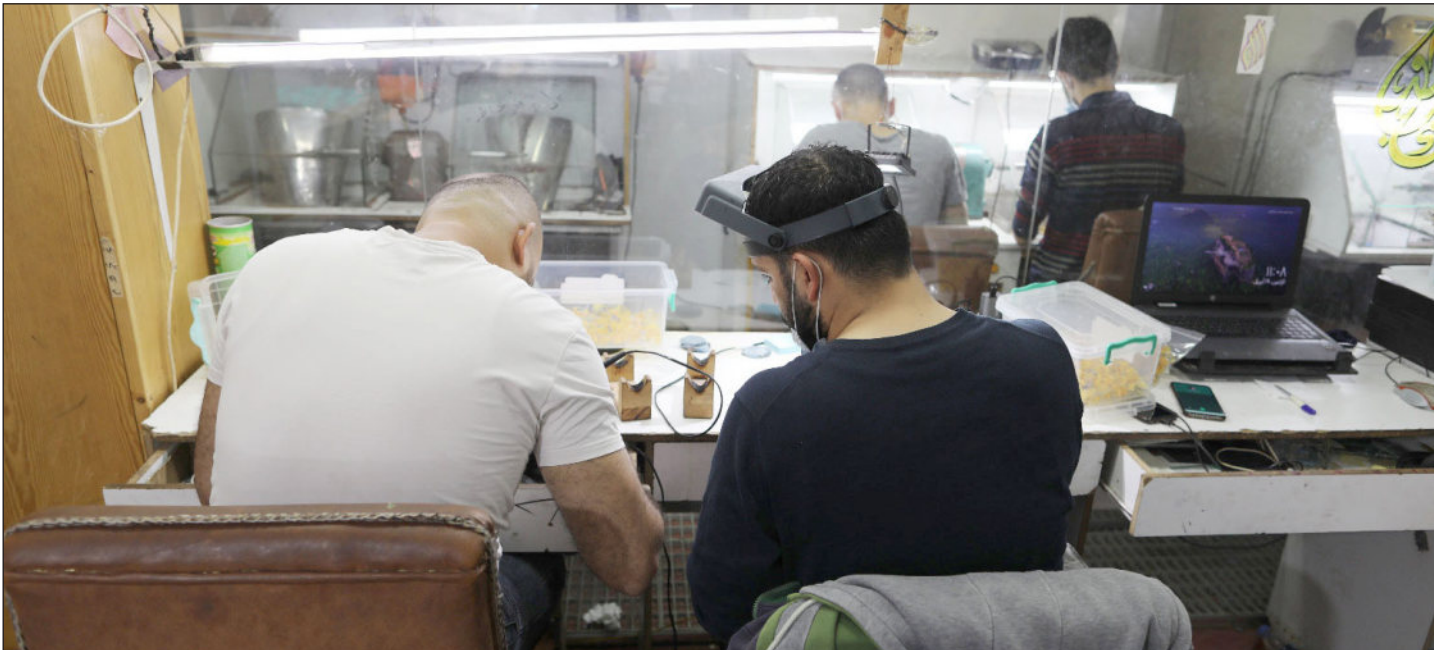
أحد مصانع إنتاج الذهب بمدينة غزة

ويتباهى سليمان بجودة إنتاجه وقدرته على منافسة المستورد، مشيرًا إلى أنه ينتج الخواتم والمحاس، والسلاسل، والأطقم وجميع الأصناف الدقيقة بمصنعه. وتطرق إلى استمرار سلطات الاحتلال منع إدخال مواد مهمة تدخل في صناعة الذهب مثل حمض النيتريك