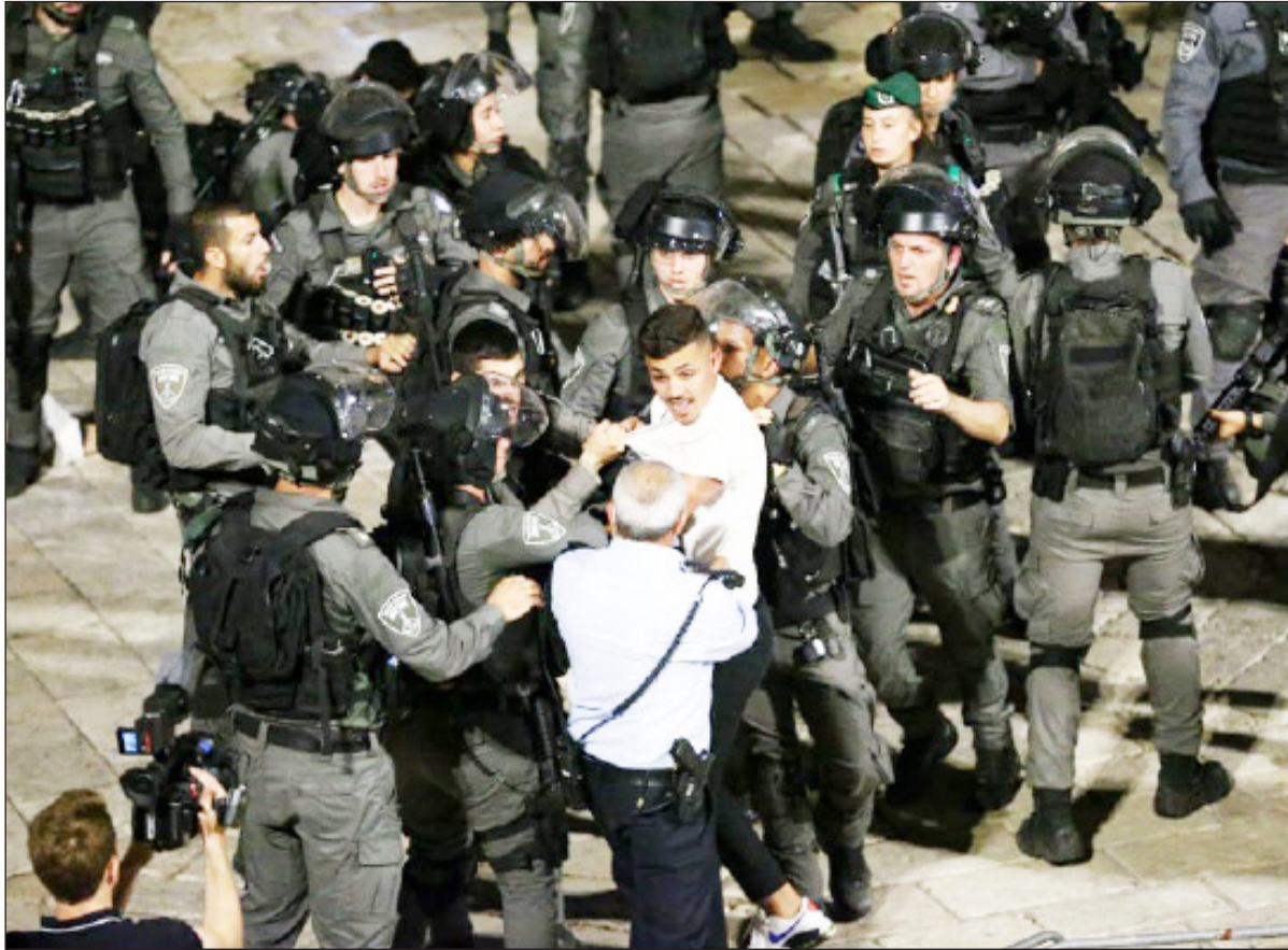
مواجهات بين الشبان الفلسطينيين وجيش الاحتلال عند باب العامود في القدس أمس