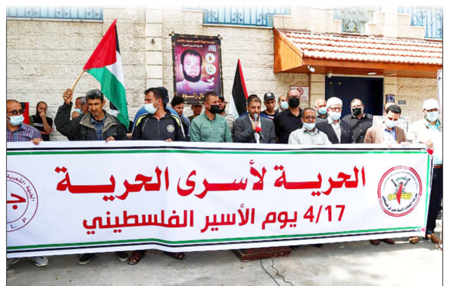
وقفة مناصرة للأسرى أمام مقر المفوض السامي في غزة أمس (Apa)