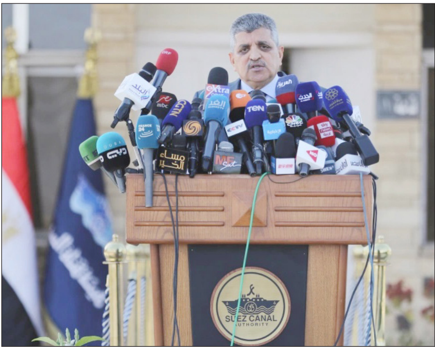
جانب من المؤتمر الصحفي لرئيس هيئة قناة السويس أمس (فلسطين)