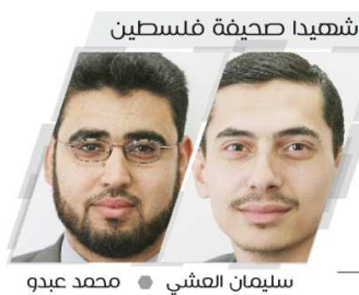
سليمان العشي ● محمد عبود

عمان/ فلسطين: أكدت عضو المكتب السياسي للجبهة الشعبية لتحرير فلسطين، ليلى خالد، أن النضال المسلح هو الطريق الأساسي للشعوب من أجل نيل حريتها، إضافة إلى كل أشكال النضال الأخرى. وقالت خالد في مقابلة متلفزة، أمس، في ردها على سؤال بشأن المقارنة بين النضال المسلح والمفاوضات التي تمت بعد اتفاق أوسلو عام 1993: "إن النضال المسلح غيّب والمفاوضات لم تعط شيئاً"، مؤكدة أن الكفاح المسلح أعطى للشعوب وطناً محرراً من الاستعمار. واستشهدت بدولة الجزائر واستقلالها بعد 130 عاماً من الاستعمار الفرنسي، إذ أنجز انتصار كبير من خلال النضال المسلح. وأردفت: "كل هؤلاء وغيرهم من الشعوب التي حققت انتصاراً لقضيتها، كان بفعل الكفاح المسلح وليس على طاولة المفاوضات". في سياق منفصل، أكدت خالد أنها بصحة جيدة، وقد انتهت من علاج مرض السرطان، مشيرة إلى أنها تمارس حياتها طبيعياً.