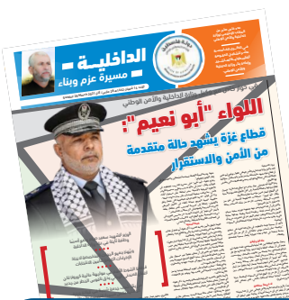
مع "فلسطين" اليوم