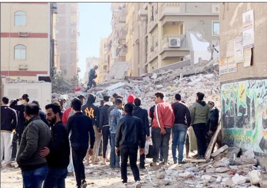
آثار انهيار عقار شرقي القاهرة أمس (فلسطين)

وقال البيان حينها، إن 5 أشخاص لقوا مصرعهم من جراء انهيار العقار، قبل أن تتحدث "الأهرام" في وقت لاحق عن ارتفاع القتلى إلى 8. ولم يصدر عن وزارة الصحة بيان بشأن ضحايا الحادث حتى الساعة 15: 45 ت.غ.