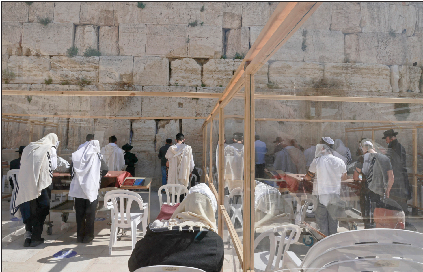
مستوطنون يؤدون طقوساً تلمودية أمام حائط البراق في الأقصى أمس

بحر: اختزال فلسطين بحدود 67 والمقاومة بالسلمية مرفوض