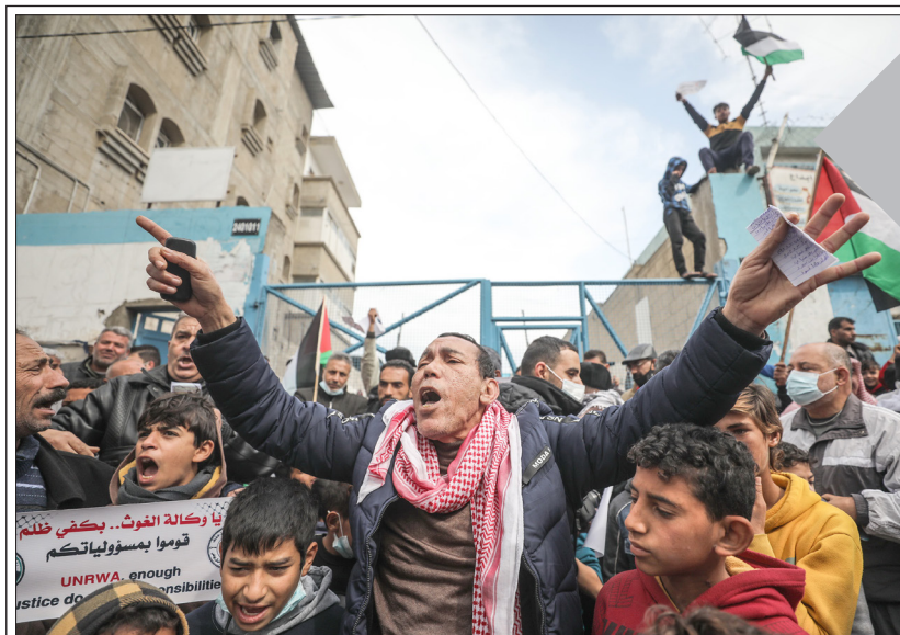
لاجئون يتظاهرون أمام مقر تابع لوكالة الغوث بخان يونس أمس

لاجئون يتظاهرون في خان يونس ضد تقلصات مساعات "أونروا"