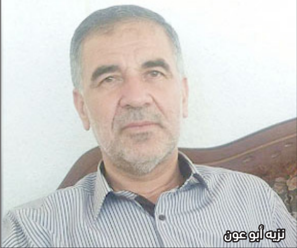
تريه أبو عون

بدوره أكد القيادي في حركة حماس نادر صوافطة أن الرد الفعلي والحقيقي على اعتقال الاحتلال لقيادات العمل الوطني والإسلامي، "يكون بالتمسك بفكرهم، ودعم خيارهم المقاوم في الانتخابات التشريعية المقبلة".