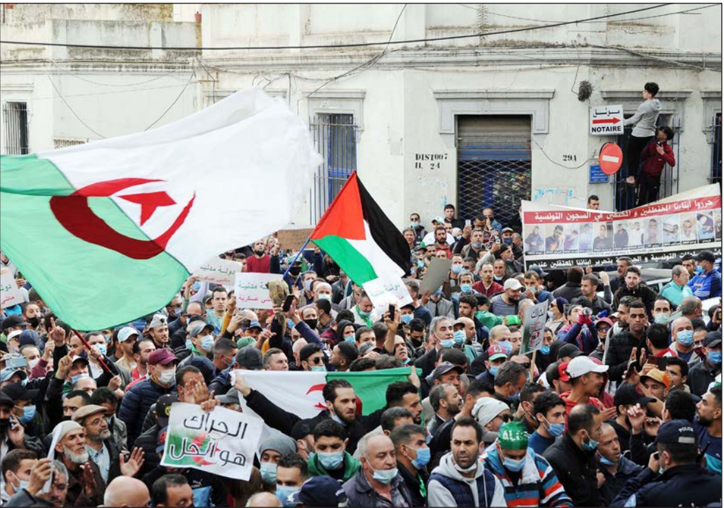
حراك شعبي في الجزائر العاصمة أمس

والأربعاء، تعهد الرئيس تبون، في رسالة للجزائريين بمناسبة ذكرى تأميم المحروقات في 24 فبراير،