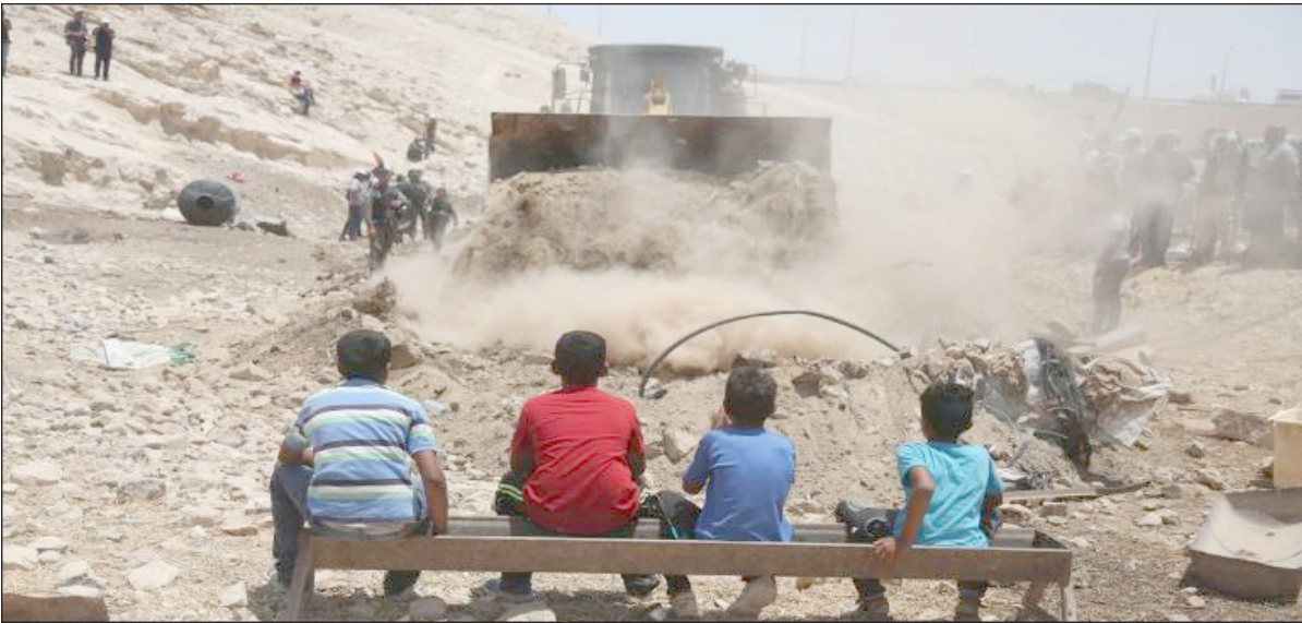
أطفال من الخان الأحمر يجلسون أمام جرافة الاحتلال في أثناء تجريفيها القرية

يوميًا يُلاحق المستوطنون السكان ويقتحمون منازلهم ليلا ونهارا وينغصون عليهم حياتهم، لافتا إلى أن جائحة كورونا زادت من صعوبة حياتهم. وأشار إلى أن الوصول للمشافي أمر صعب جدا "فالحصول على سيارة للتنقل يستغرق قرابة ثلاث ساعات".