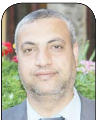
بقلم: ماجد الزبدة

مع تصاعد نبرة التصريحات الفتاوية المفاجئة ضد حركة حماس، وعدم إقدام عباس على تشكيل محكمة الانتخابات وفق ما اتفق عليه في حوار القاهرة حتى اللحظة، ونكوصه عما اتفق عليه وطنياً من شروط الترشح، وفي ظل تسريبات بوجود ضغوط دولية على عباس بضرورة إجراء الانتخابات، يبرز تساؤل مهم: هل تسعى حركة فتح لتجديد شرعية عباس من خلال إجراء الانتخابات في الضفة واتهام حماس بأنها هي من عطل إجرائها في غزة؟