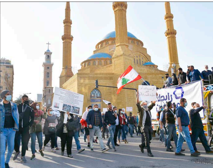
مئات اللبنانيين في مسيرة جابت وسط العاصمة بيروت أمس (الأناضول)

ومنذ 17 أكتوبر/تشرين الأول 2019، تصف لبنان أزمة مالية واقتصادية حادة، دفعت اللبنانيين للاحتجاج في الشوارع. ومع اشتداد الأزمة، فرضت المصارف حظراً على سحب الودائع بالعملات الأجنبية، وقيدت السحب بالليرة اللبنانية. وتمز البلاد بأسوأ أزمة سياسية واقتصادية مع تعرّث تشكيل حكومة جديدة برئاسة سعد الحريري، تخللها انهيار بقيمة العملة المحلية، وارتفاع التضخم لمستويات تاريخية ونقص حاد بالنقد الأجنبي. ويبلغ سعر الدولار في السوق السوداء حوالي 9 آلاف ليرة لبنانية حالياً، بعدما كان الدولار يساوي 1.500 ليرة قبل الأزمة.