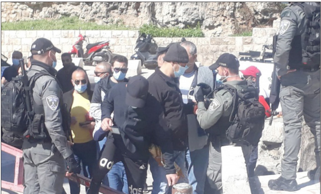
جنود الاحتلال يمنعون أهالي الضفة من الوصول للأقصى أمس