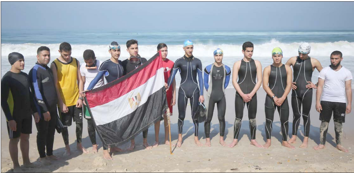
فلسطينيون يستعدون للبحث عن بحارة مصريين في البحر بعد غرق قاربهم

لكنه نبّه في الوقت ذاته إلى أن مجتمع البحارة في بحر غزة أمام مدينة الزهرة تحديداً، لوجود عوائل بحرية متعددة، بحسب أبو مرزوق، الذي أضاف: "خاطرنا ونزلنا إلى البحر رغم ارتفاع الأمواج وتوقعنا العثور على شيء، لكننا لم نجد شيئاً للأسف". كما انطلق سباحون ومنقذون من ميناء غزة، والقول لأبو مرزوق، ضمن دوريات بحث بحرية إلى حدود شاطئ النصيرات وسط القطاع، مع تفتيش حوض الميناء، وعمليات تمشيط لشواطئ بحر الزهرة، بقوارب صيد صغيرة "حسكات".