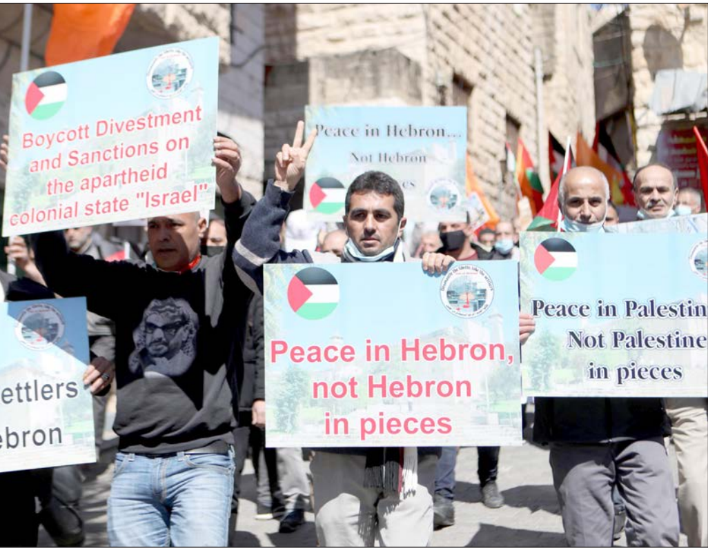
جانب من الوقفة أمس