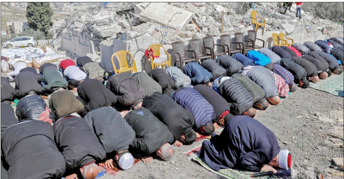
الشيخ عكرمة صبري يؤم المواطنين في صلاة الجمعة أمام ركام منزل عائلة عليان

متأخرة من الليلة قبل الماضية، خيمة مأوى عائلة عليان في العيسوية بالقدس المحتلة، بعد بضعة أيام من هدم بنائهم السكنية.