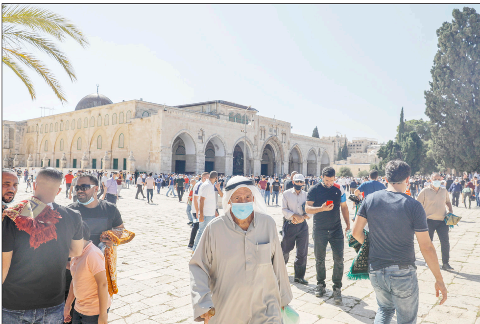
مواطنون في باحات المسجد الأقصى عقب صلاة الجمعة