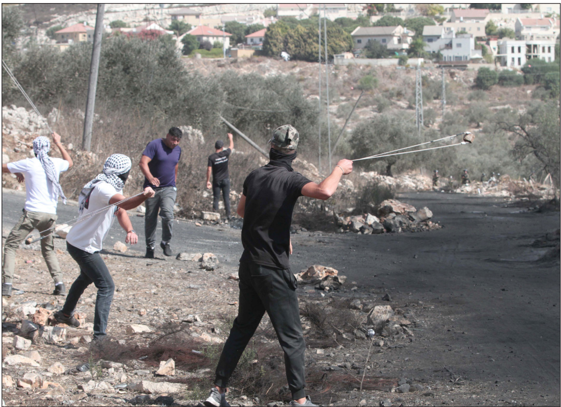
شبان يرشقون جنود الاحتلال بالحجارة خلال مسيرة كفر قدوم رفضاً للاستيطان