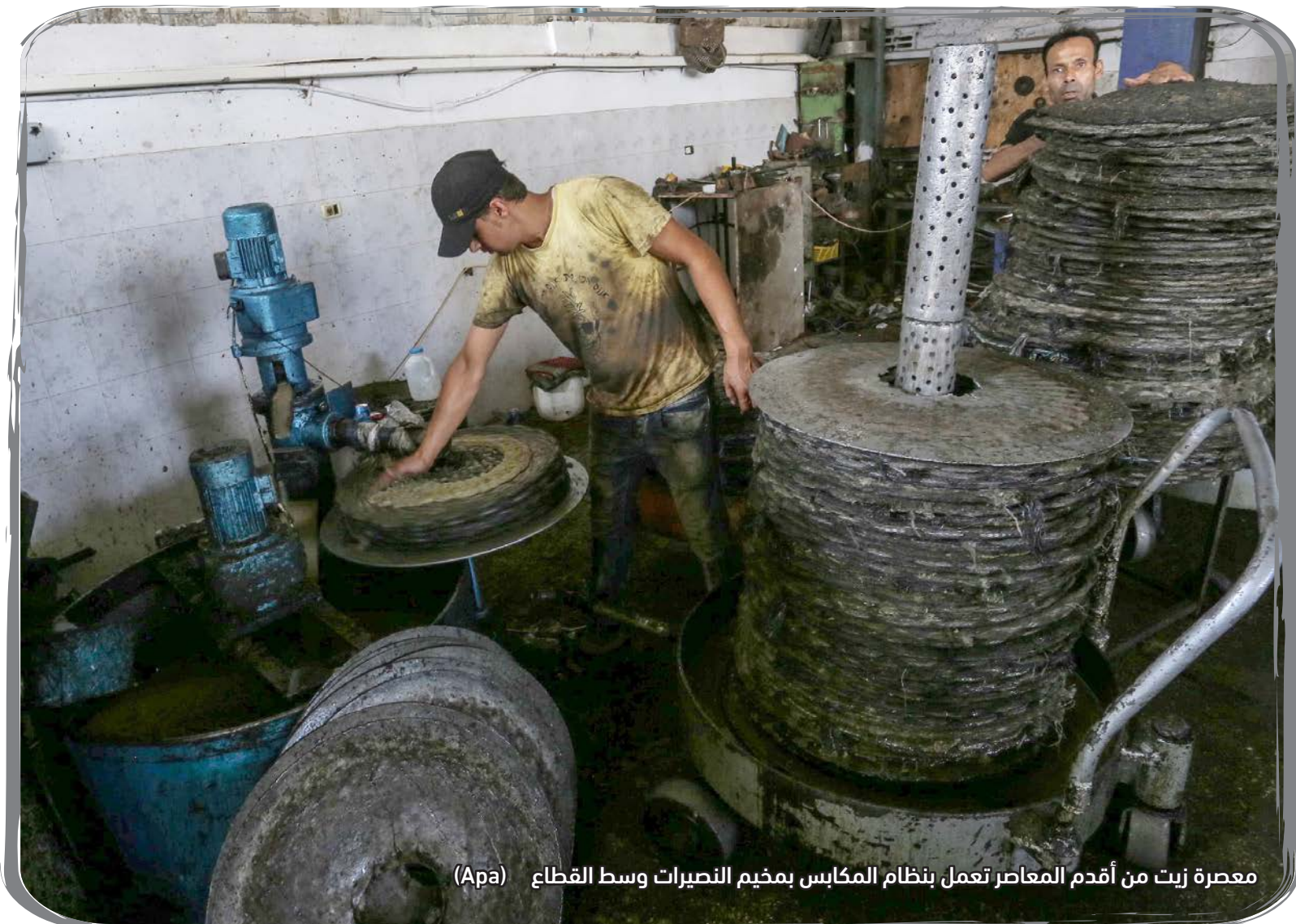
معصرة زيت من أقدم المعاصر تعمل بنظام المكابس بمخيم النصيرات وسط القطاع