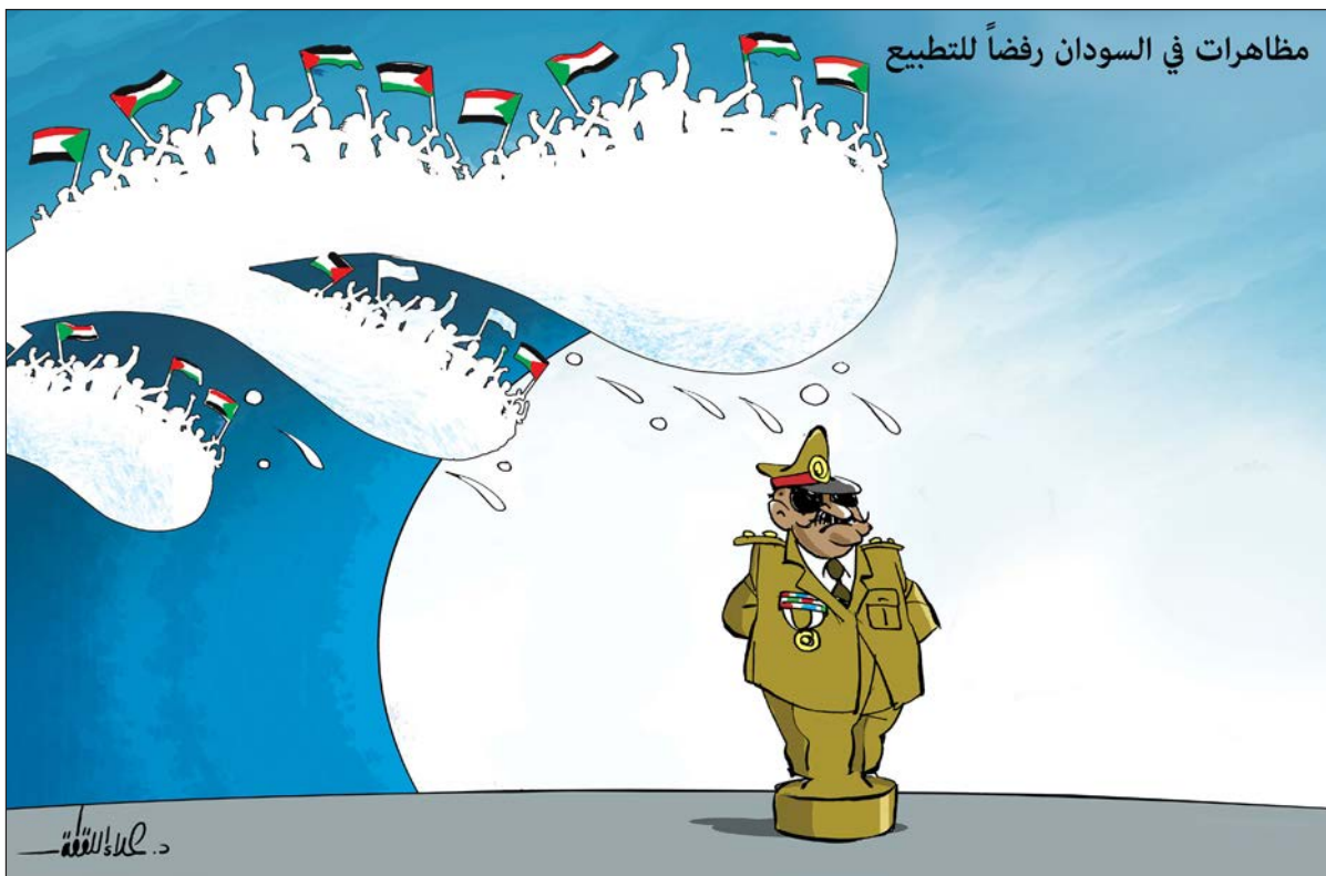
مظاهرات في السودان رفضاً للتطبيع