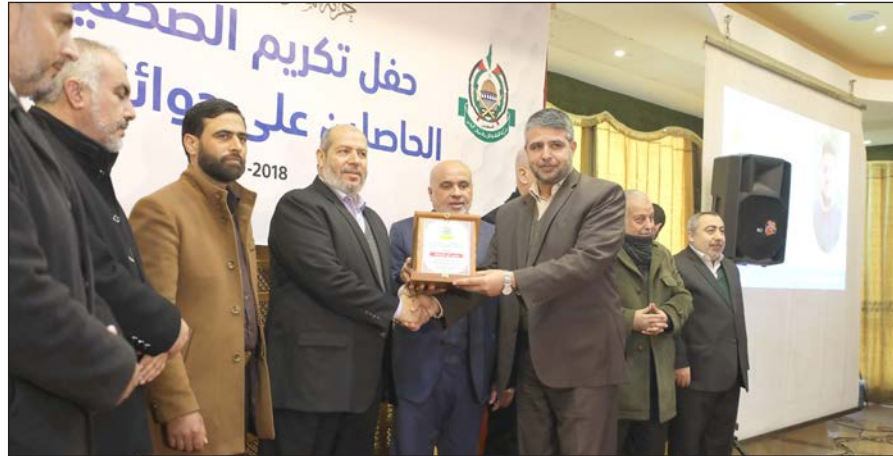
جانب من حفل التكريم أمس

وقال عمارنة في كلمة مسجلة له خلال الحفل: إن غزة هي قدوة في الصبر والحفاظ على كرامة الشعب والأمة، مضيفاً "منذ لحظات إصابتي الأولى، أحسست أن العالم قد انتهى وكل شيء في حياتي انتهى ولكن وقوفكم بجانبى ووقوف كل الشعوب وكل الصحفيين أشعروني أنني ولدت من جديد". وأكد أنه سيعود لعمله بعد انتهاء علاجه بقوة أكبر حتى يستطيع توصيل رسالة الشعب الفلسطيني للعالم "والغطية مستمرة".