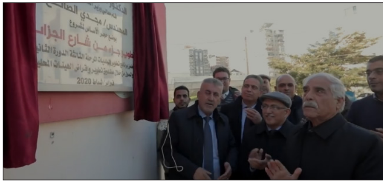
جانب من الافتتاح