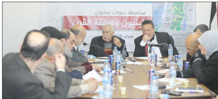
جانب من الفعالية أمس

يعمل إلى جانب شركات أمنية دون أي اكتراث لخطورة ذلك.