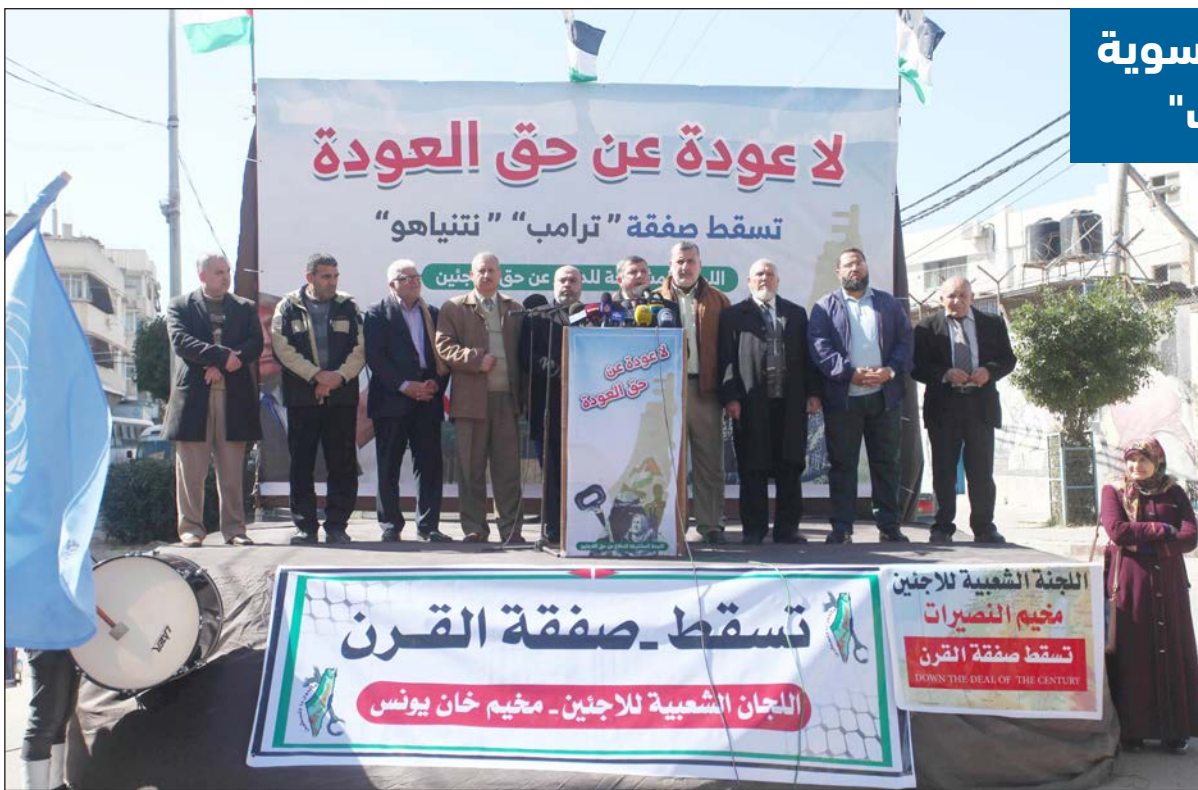
وقف احتجاجية رافضة لصفقة القرن أمام مقر "أونروا" في غزة أمس

محافظات/ عبد الله التركماني: هدمت سلطات الاحتلال الإسرائيلي، أمس، منزلاً في حي الثوري بالقدس المحتلة، وآخر في منطقة جبل جوفر، شرق مدينة الخليل. وهدمت سلطات الاحتلال،