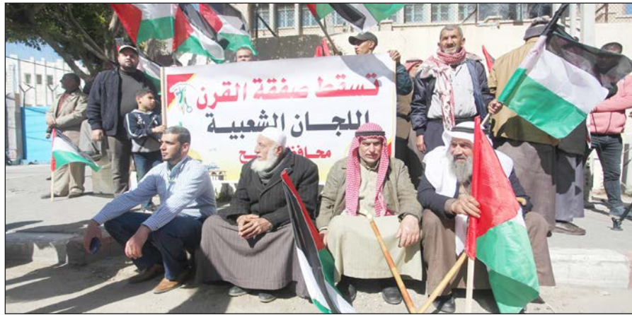
فعالية رافضة لصفقة القرن في غزة أمس

وفي 28 من يناير/ كانون الثاني الماضي، أعلن الرئيس الأمريكي ترامب برفقة رئيس حكومة الاحتلال الإسرائيلي بنيامين نتنياهو خطة السلام الأمريكية والمعروفة باسم صفقة القرن، تقوم ركائزها على سلب الفلسطينيين حقوقهم وأرضهم ومقدساتهم. وعلى إثر الصفقة تستمر الفعاليات الشعبية والرامية للصفقة، في الضفة الغربية وقطاع غزة، وعدد من الدول العربية والغربية.