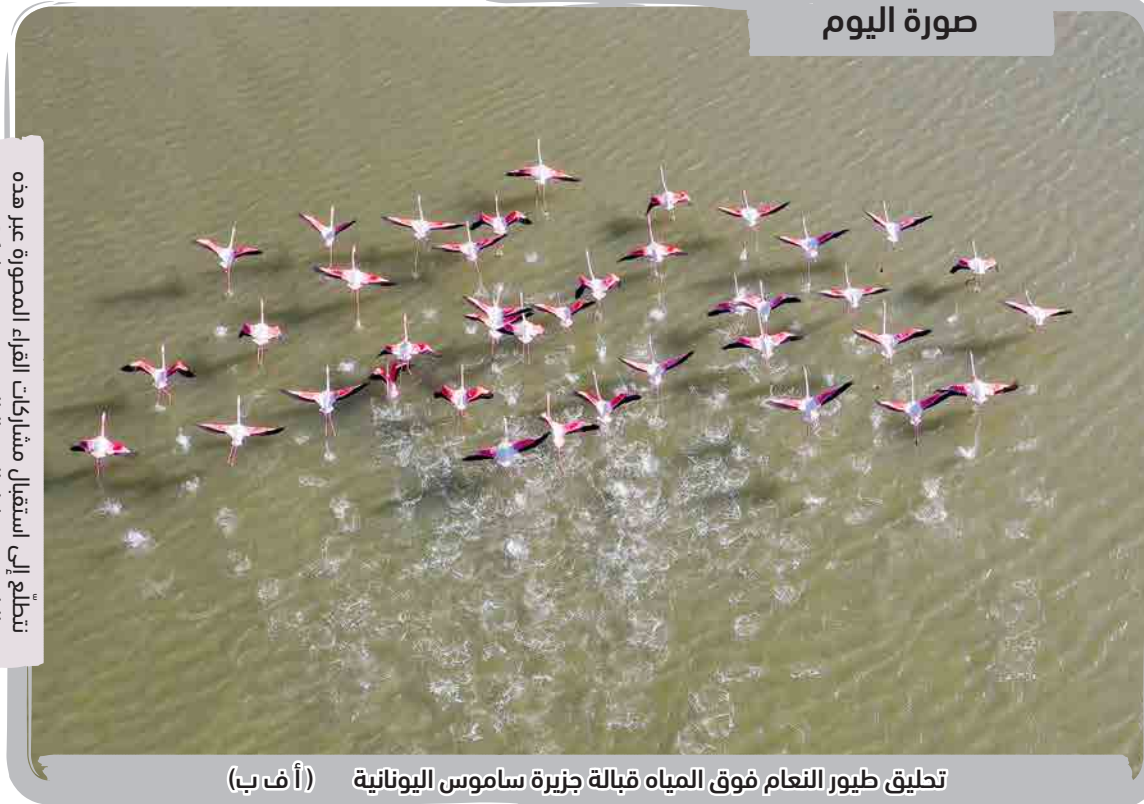
تحليق طيور النعام فوق المياه قبالة جزيرة ساموس اليونانية