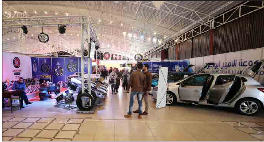
جانب من المعرض في غزة أمس