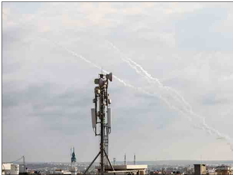
إطلاق رشقات صاروخية تجاه أراضيها المحتلة