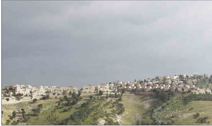
مستوطنة معاليه أدوميم

من جهتها أدانت الحكومة البريطانية قرار حكومة نتنياهو بالمضي قدماً في بناء 1077 وحدة سكنية جنوب القدس المحتلة، والذي جاء بعد الإعلان عن عزمها بناء 2200 وحدة أخرى جديدة في القدس. وأكد بيان الحكومة البريطانية، الذي صدر أمس على لسان وزير الدولة البريطاني للشؤون الخارجية جيمس كليفرلي، أن «المستوطنات تقوض قابلية إقامة دولة فلسطينية في المستقبل وعاصمتها القدس الشرقية». وشدد البيان على أن «موقف المملكة المتحدة من المستوطنات الإسرائيلية واضح بعدم قانونيتها بموجب القانون الدولي، وأن استمرار الاستيطان يقوض الجهود لبدء مفاوضات سلام جديدة». كما طالب إسرائيل بالوقف الفوري للنشاطات الاستيطانية.