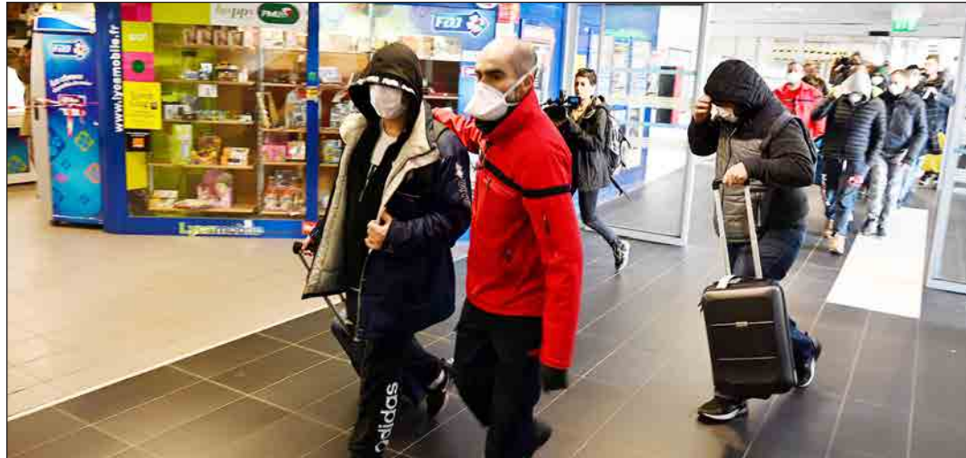
إجلاء حافلة من الركاب بالصين للاشتباه بأنهم مصابون بالفيروس أمس

باريس / وكالات: عززت موجة جديدة من الوفيات والإصابات الناجمة عن فيروس كورونا المستجد في إيران واليابان وكوريا