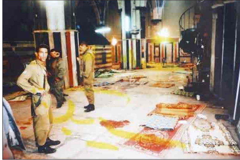
مجزرة الحرم الإبراهيمي في الخليل (أرشيف)

الخليل بعد القدس". واعتبرت حركة الأحرار عدم التحرك الجدي لتقديم ملفات قادة الاحتلال للمحاكم الجنائية لمحاسبتهم على مجزرة الحرم الإبراهيمي وما قبلها وما بعدها "هو من شجعهم على الاستمرار في عدوانهم وجرائمهم وقتلهم وتنكيلهم بشعبنا وشهداءه"، داعية السلطة للتحرك الفوري لتقديم جرائم الاحتلال أمام الجنايات الدولية.