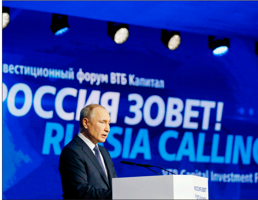
جانب من كلمة بوتين أمس