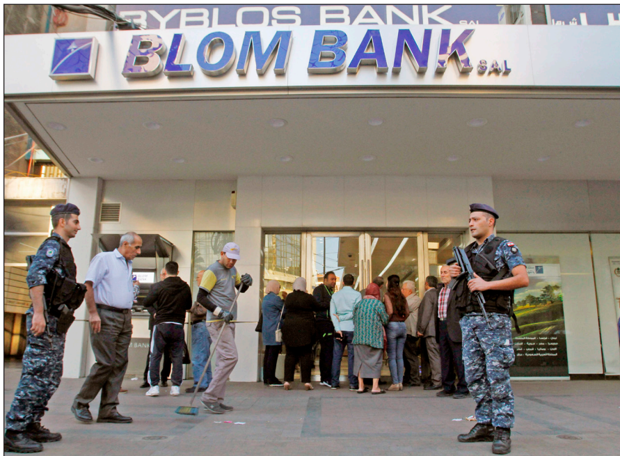
جانب من الاعتصامات في لبنان أمس (ا ف ب)

الشعبي المنتفض منذ 35 يوما، كما توجه متظاهرون في محافظة عكار (شمال) إلى دوائر ومؤسسات حكومية بهدف إغلاقها من أجل الضغط على الطبقة الحاكمة لكي تحقق مطالب الحراك الشعبي، ومن أبرزها تشكيل حكومة إنقاذ وطني والدعوة لانتخابات عامة مبكرة، ومكافحة الفساد.