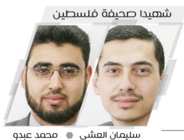
شهيداً صحفياً فلسطينياً