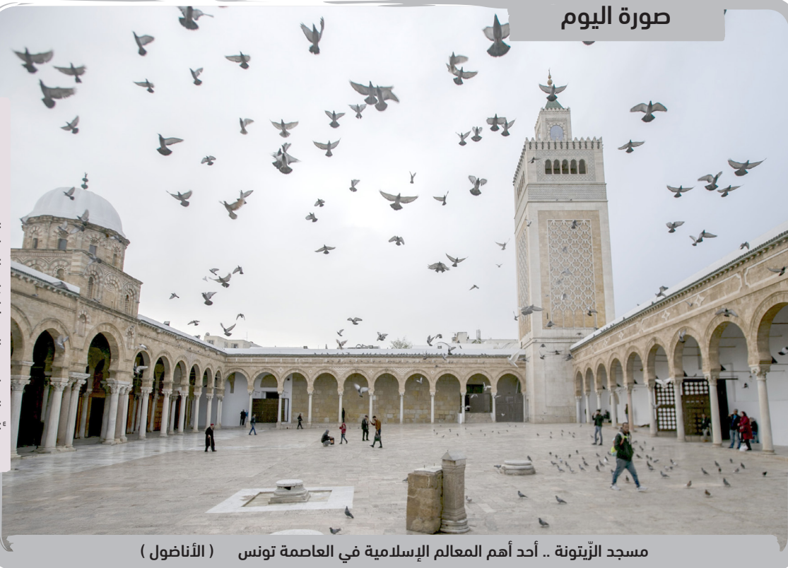
مسجد الزيتونة .. أحد أهم المعالم الإسلامية في العاصمة تونس