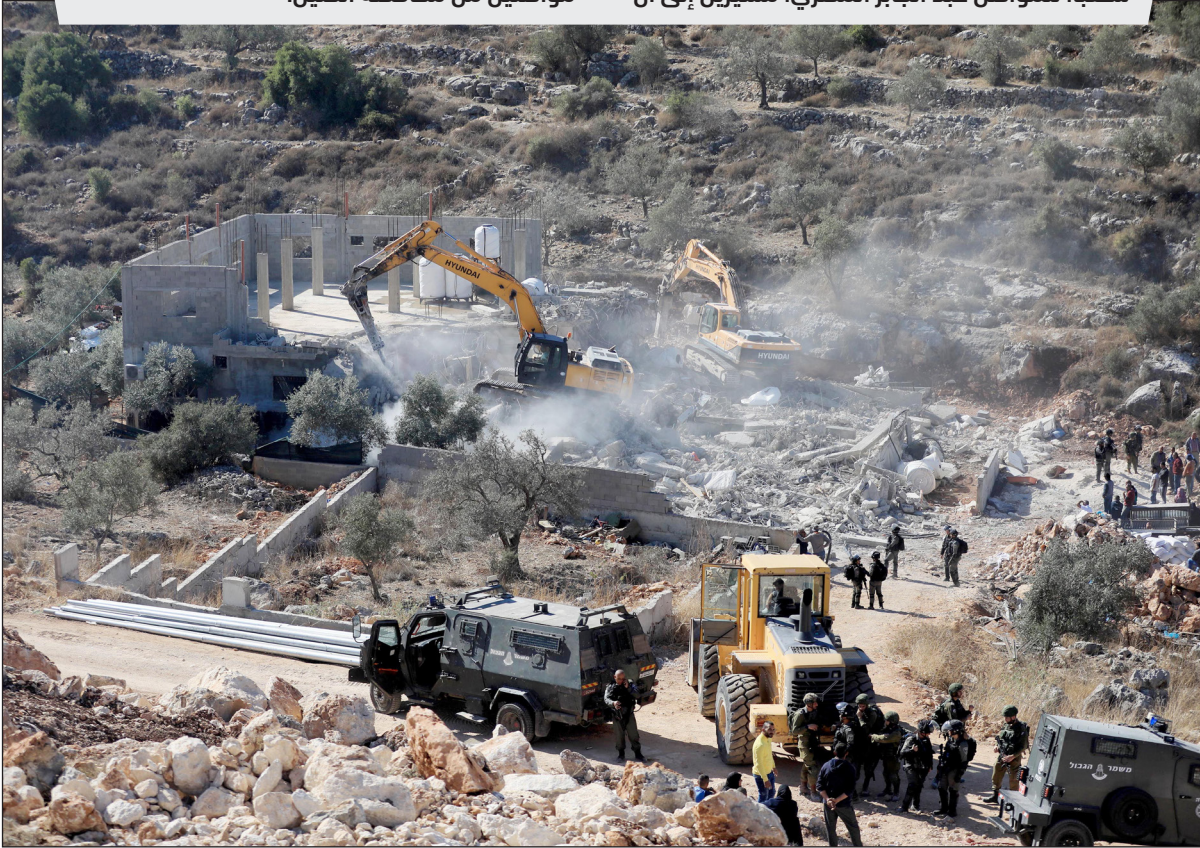
الجيش الإسرائيلي يهدم منزلين وسط الضفة المحتلة بدعوى البناء دون ترخيص أمس