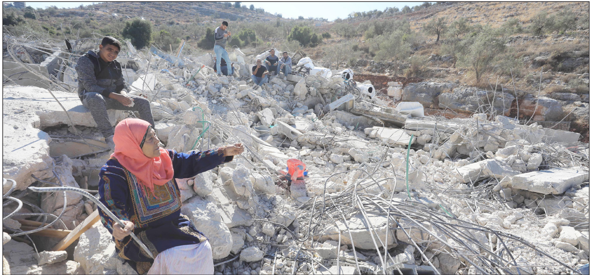
قوات الاحتلال تهدم منزلين في بلدة شقبة غربي رام الله (الأناضول)

الدولية والقانون الدولي وكل المنظمات التي تعنى بحقوق الإنسان. وأضاف دغلس لصحيفة «فلسطين» أن (إسرائيل) والولايات المتحدة تتصرفان بجنون في ضوء شعورهما بالعزلة، ومن منطلق استحقاقات ومزايدات انتخابية.