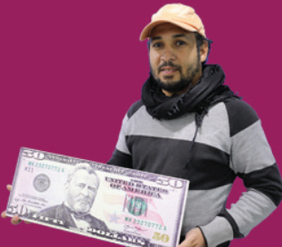
نافذ النجار - خانيونس