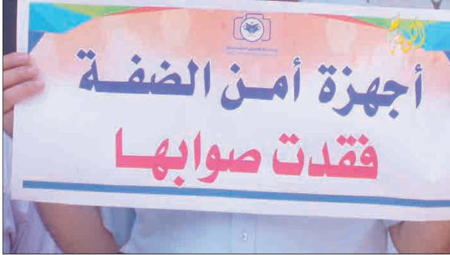
أجهزة السلطة تواصل قمع الحريات في الضفة المحتلة

ورأت أن اعتقال الصحافي القواسمي، خطوة جديدة في إطار إصرار الرئاسة الفلسطينية على تنفيذ سياسات حكومية فلسطينية ترمي لتقييد الحقوق والحريات، وخاصة الحريات الصحفية.