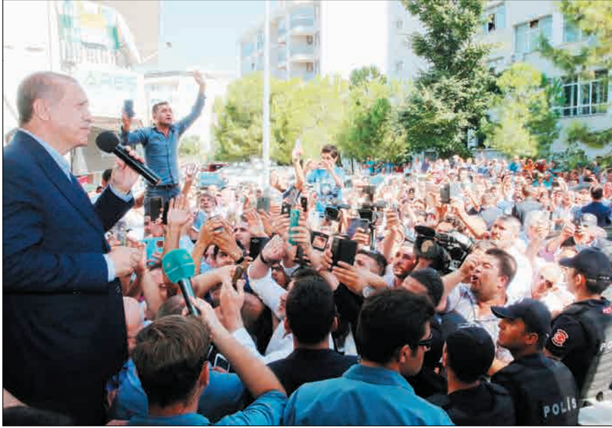
أردوغان خلال كلمته أمام مبنى حزب العدالة والتنمية بإسطنبول

وصباح أمس تظاهر العشرات امام مقر السفارة حيث انتشرت الشرطة المسلحة وتم تثبيت السياج الشائك في محيط المقر.