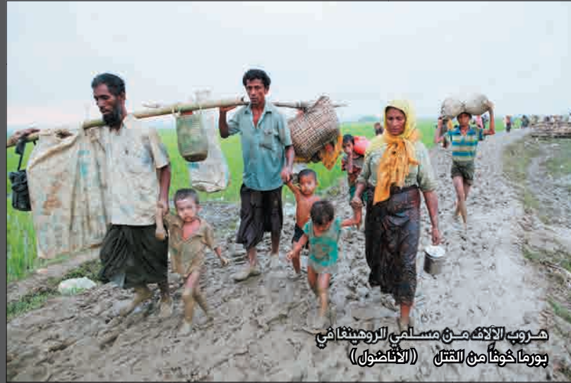
هروب الآلاف من مسلمي الروهينغا في بورما خوفًا من القتل

وقالت ليوا لبرنامج "نيوزداي" على إذاعة بي بي سي وورلد سيرفيس التابعة لهيئة الإذاعة البريطانية (بي بي سي): "حاصرت قوات الأمن القرى، ثم أطلقت الرصاص على الناس عشوائيًا، لكننا وجدنا أيضًا أن هناك توطأ أكبر من جانب السكان البوذيين جنبًا إلى جنب مع الجيش، وذلك بالمقارنة ربما مع العنف الذي وقع في أكتوبر/تشرين الأول ونوفمبر/تشرين الثاني من العام الماضي 2016".