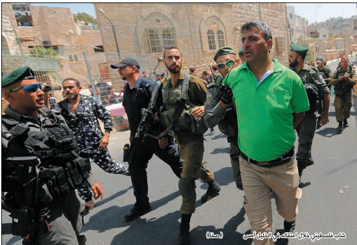
شاب فلسطيني خلال اعتقاله في الخليل أمس (صحفاً)

محافظات/ فلسطين-وكالات: أصيب مواطن فلسطيني برصاص قوات الاحتلال الإسرائيلي التي اعتقلت كذلك 5 مواطنين من محافظات مختلفة من الضفة الغربية المحتلة، فجر