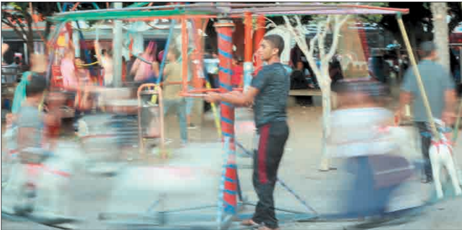
شاب يقود أرجوحة للأطفال خلال العيد وسط غزة