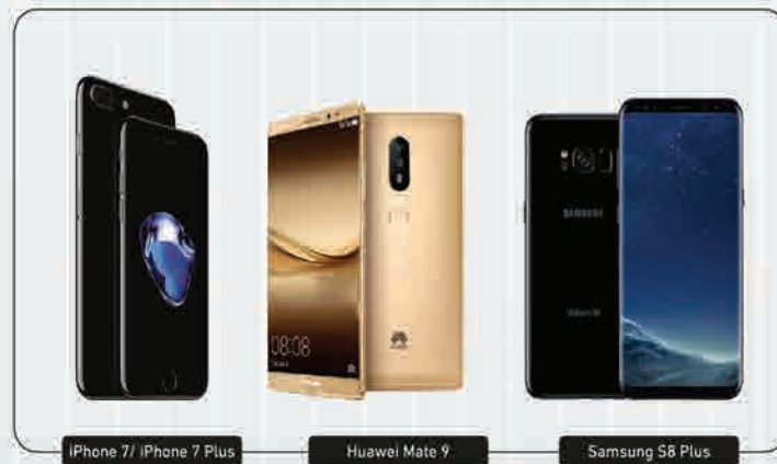
iPhone 7/ iPhone 7 Plus