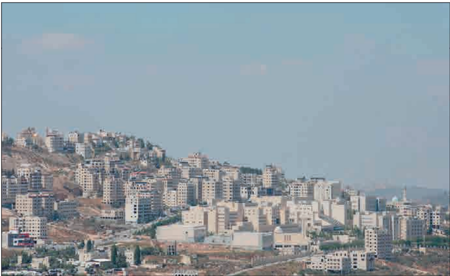
ارتفاع وتيرة التوسع الاستيطاني في نابلس ( أرشيف )

من أمس، على تخصيص مبلغ 60 مليون شيكل (16.7 مليون دولار) لبناء مستوطنة "عميحي" البديلة لبؤرة "عمونة" اليهودية التي أخلت منذ أشهر.