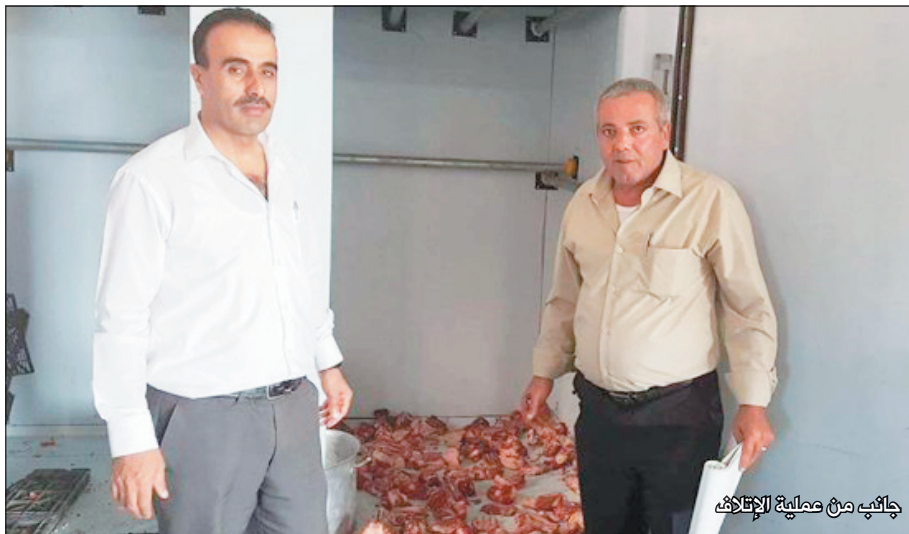
جانب من مملية الإغلاف