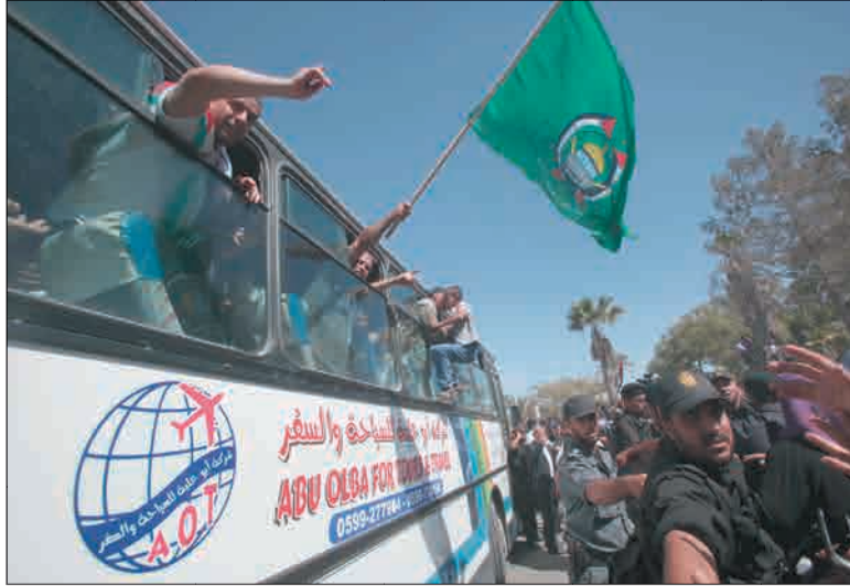
الإفراج عن الأسرى في صفقة وفاء الأحرار الأولى ( أرشيف )