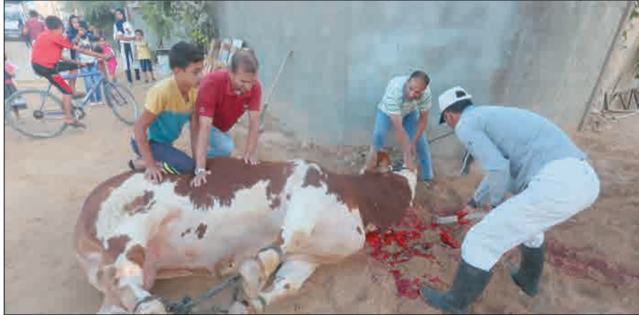
غزيون خلال ذبح الأضحية